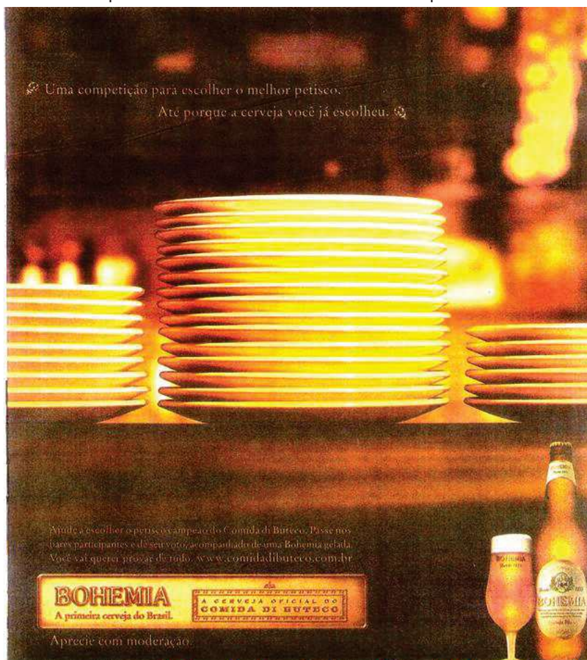
Figura 3 — Anúncio publicitário 03 – BOHEMIA A primeira cerveja do Brasil