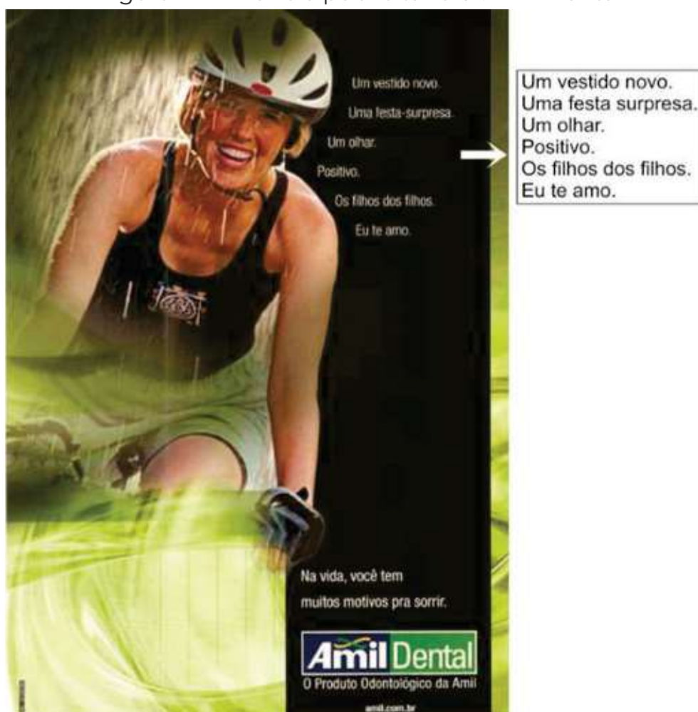
Figura 1 — Anúncio publicitário 01: AmilDental

constituintes seriam “frases nominais”. Tais estruturas servem a objetivos comunicativos ligados ao destaque de informações, uma vez que contribuem para dar relevo, ênfase ao que é dito, comprovando a força argumentativa que têm. No caso dos anúncios publicitários, o uso dessas estruturas estaria a serviço da função primordial do gênero: reforçar a argumentação para que o produto ou a ideia possam ser desejados pelo consumidor, público-alvo dos anúncios. Essa garantia de sedução é dada pela força ilocucionária de argumentação atingida pela presença das estruturas desgarradas no texto dos anúncios publicitários. No anúncio publicitário 1, a seguir, é possível perceber a ocorrência de SNs soltos e a importância que eles têm para a valorização do produto anunciado.