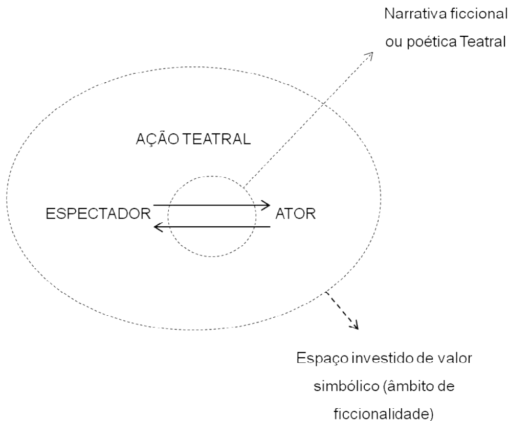
Figura 2 – Proposta de esquema para a identificação proposta pelo teatro contemporâneo

O personagem, enquanto entidade de ficção densa e elaborada, é nesse esquema mero coadjuvante, uma vez que se pensa a identificação espectador/ator como componente de uma ficção que caminha pela tangente, uma ficção que está diariamente presente na vida de todo ser humano. Ou seja, atores e espectadores se identificam enquanto seres ficcionalizadores, movidos por uma pulsão de ficção.