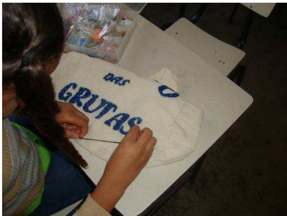
Figura 10 Trabalho realizado com miçangas na confecção de bolsas referente ao projeto.