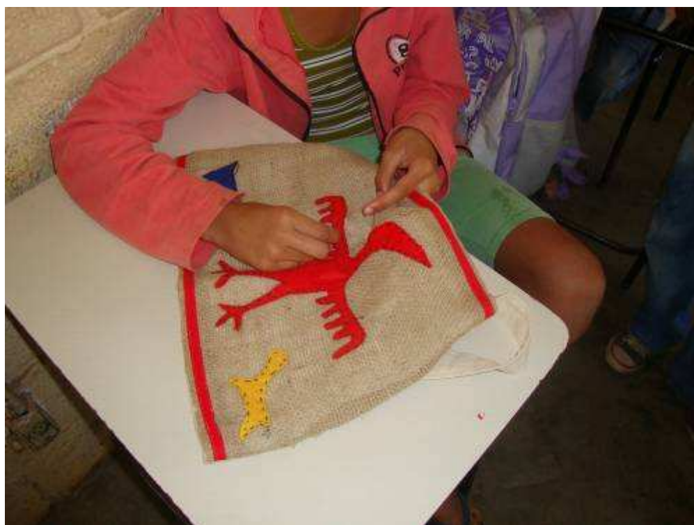
Figura 9 Trabalho manual, com tecido reproduzindo as imagens rupestres observadas na Gruta Ballet e também nos exemplos de imagens de outras grutas.