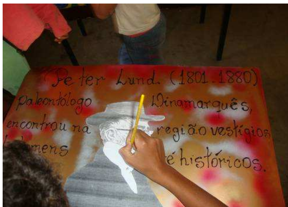
Figura 12 alunos do projeto confeccionando cartazes sobre Peter Lund.

“Terra de Luzia” foi o nome escolhido para Mostra Cultural, onde os alunos do Programa Curumim expuseram seus trabalhos realizados sobre a importância e preservação do patrimônio cultural com ênfase na arte rupestre.