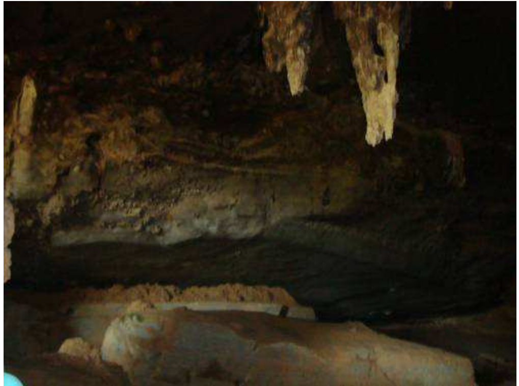
Figura 4 Interior da Gruta do Ballet