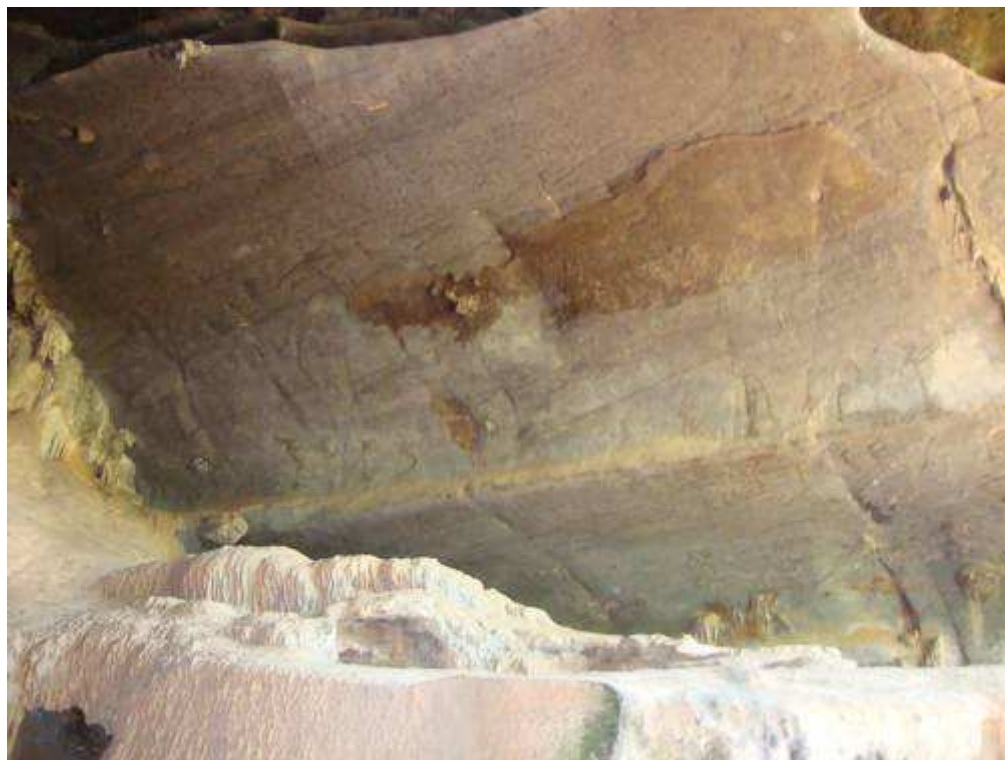
Figura 1. “Gruta Ballet”. Em seu interior encontra-se pinturas rupestres que servirão de modelo para os trabalhos realizados pelos alunos do projeto abordado no capítulo 2.

A Lapa do Ballet está inserida em um conjunto Cárstico de beleza cênica além de ser de grande importância arqueológica. Localiza-se a 1km aproximadamente do Abrigo de Poções, 500 metros à direita de Chapéu, e a 4,5km a nordeste de Matozinhos, em um rochedo calcário onde domina do alto, um riacho e uma depressão também de formação calcária.(MATOZINHOS ON LINE, 2010)