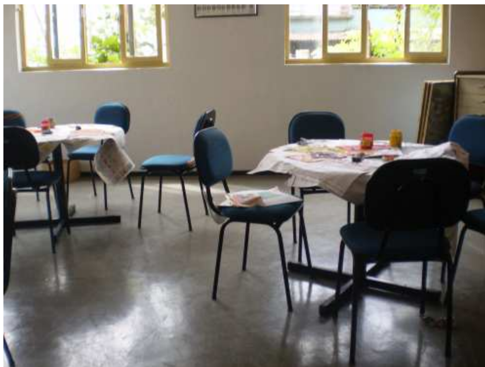
Figura 8 Sala localizada no Projeto Curumim onde foram confeccionados os trabalhos dos alunos, com destaque para as pinturas rupestres.