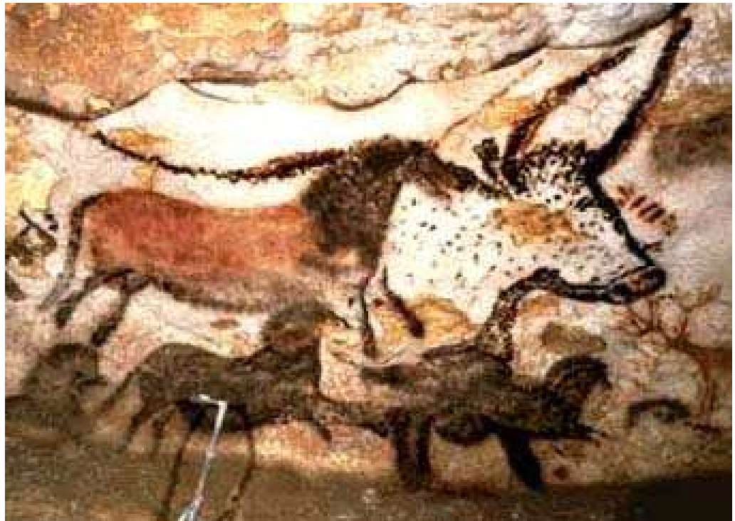
Figura 5 Cultura/França Gruta Lascaux