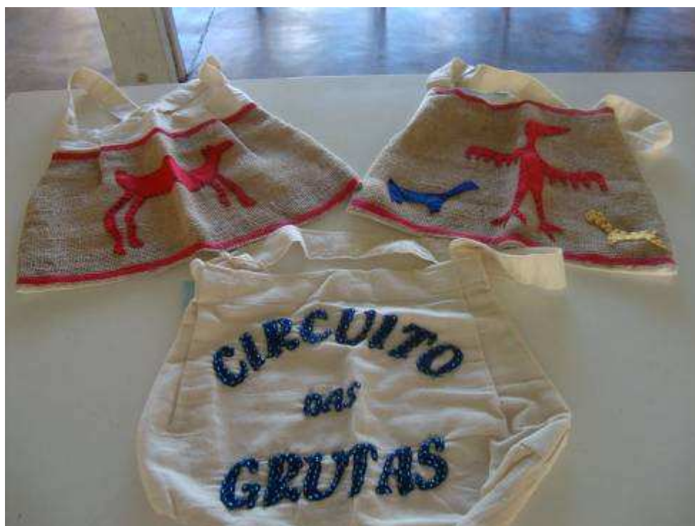
Figura 11 Bolsas confeccionadas nas oficinas realizadas no projeto e também expostas na Mostra Cultural.