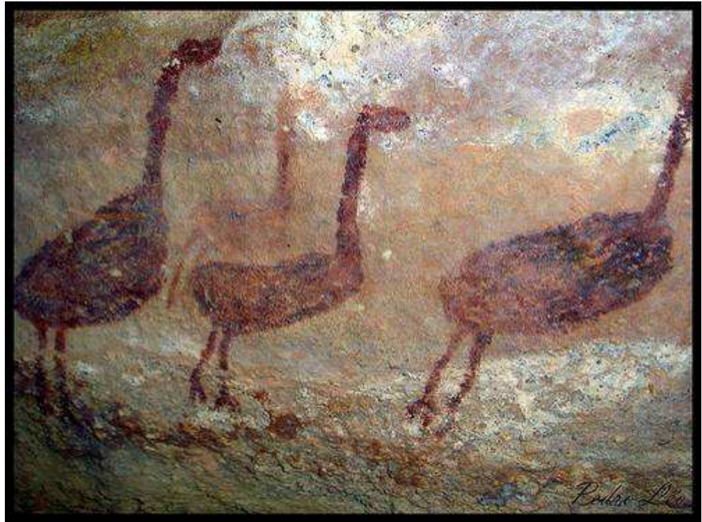
Figura 6 Pinturas datadas do período Neolítico no Parque Nacional