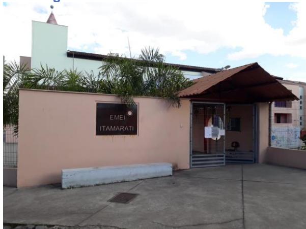
Figura 1: Fachada da EMEI Itamarati

Está localizada à Rua Comanches, número 245 – Bairro Santa Mônica. Atualmente conta com duas turmas de integral, sendo uma composta por 11 crianças com idade entre 01 e 02 anos, e outra com 17 crianças, com a faixa etária de 02 a 03 anos. A EMEI atende ainda mais onze turmas parciais no turno da manhã e onze turmas parciais no turno da tarde.