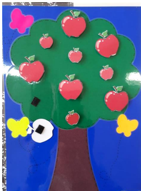
Figura 3- Material confeccionado na oficina

Finalizada a oficina e observando tudo o que confeccionado, as docentes concluíram que os materiais são facilitadores de aprendizagem não só para as crianças com deficiência, mas para todas.