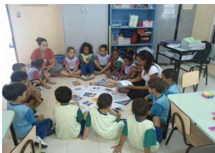
FIGURA 3- leitura de textos científicos para o projeto "O Mistério do Espaço"