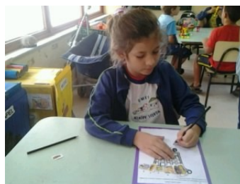
FIGURAS 13 e 14 – escrita espontânea sobre rótulos: atividades para o portfólio