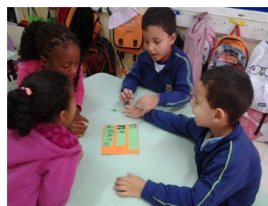
FIGURAS 4 e 5- Jogo na formação de palavras- Projeto "Romero Brito" e "O Mistério do Espaço"