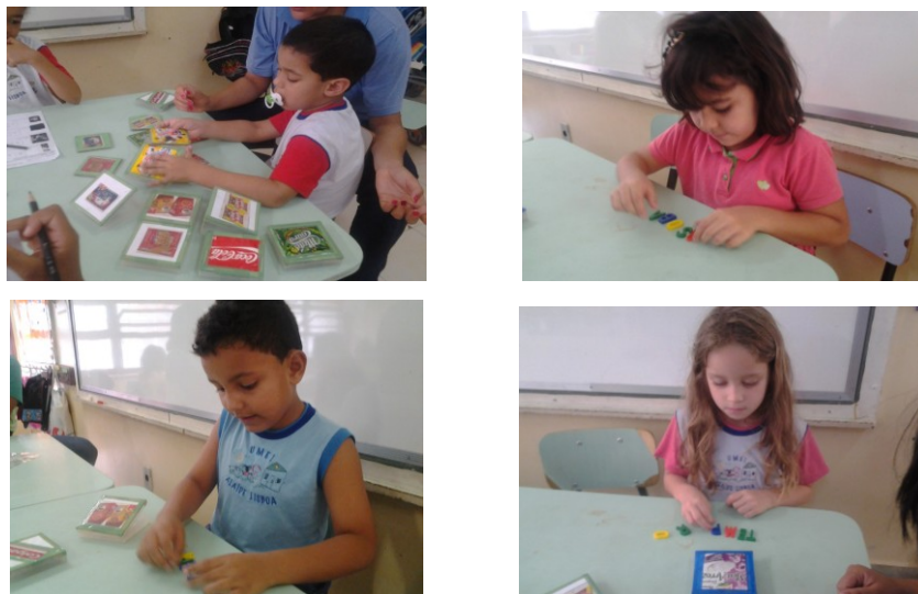
FIGURAS 6, 7, 8, e 9- Jogo na formação de palavras- trabalho com rótulos

Ao oportunizar a criança vivenciar através do jogo e da brincadeira o processo de alfabetização e letramento, o professor pode provocar a criança a pensar sobre a escrita, a tomar decisões, opinar, defender sua posição e assim estabelecer novos conhecimentos confrontando-os com as hipóteses que já possuem.