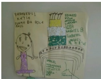
FIGURA 10 -cartão de aniversário construído pela turma

Com base no que Soares aponta no trecho acima, foi possível observar algumas práticas de letramento com a proposta de construção da escrita. Em uma proposta de texto coletivo a turma produz um cartaz de aniversário para ser entregue a vice diretora. Outra atividade realizada foi a construção do jornal mural com a intenção de informar as atividades que acontecem na escola. Com tais práticas a professora possibilita a criança a pensar sobre as características do texto a ser produzido.