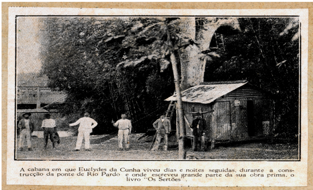
A cabana em que Euclides da Cunha viveu dias e noites seguidas, durante a construção da ponte de Rio Pardo e onde escreveu grande parte da sua obra prima, o livro "Os Sertões".

(Cabana em que Euclides da Cunha escreveu o livro Os sertões . 1898. Local: São José do Rio Pardo – SP. Acervo Casa Euclidiana – SP).