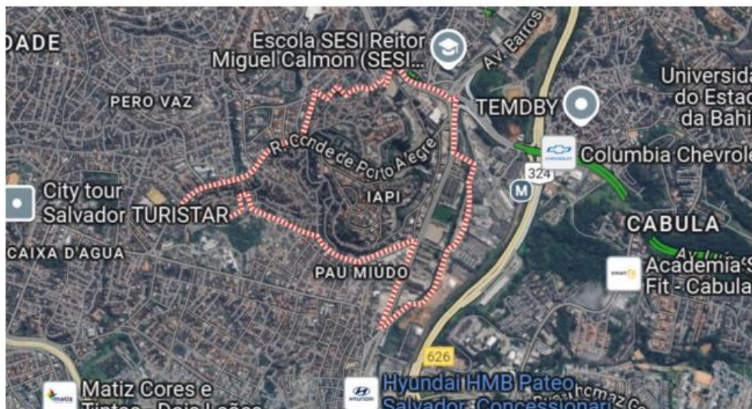
FIGURA 1. Delimitação geográfica do bairro IAPI, Salvador, Bahia, via satélite.

O IAPI é um bairro pertencente ao município de Salvador, capital do estado da Bahia com população de 2.417.678 habitantes, segundo o Censo Demográfico do IBGE de 2022 (IBGE, 2022). Uma cidade famosa por suas praias paradisíacas e cultura rica e diversa, Salvador é marcada por muitos contrastes sociais. Ao passear pela orla, observamos grandes prédios e residências luxuosos e espaçosos, porém na zona periférica a realidade é bastante diferente.