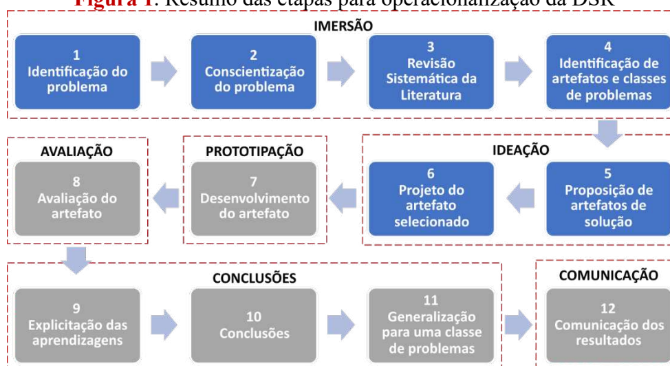
Figura 1. Resumo das etapas para operacionalização da DSR