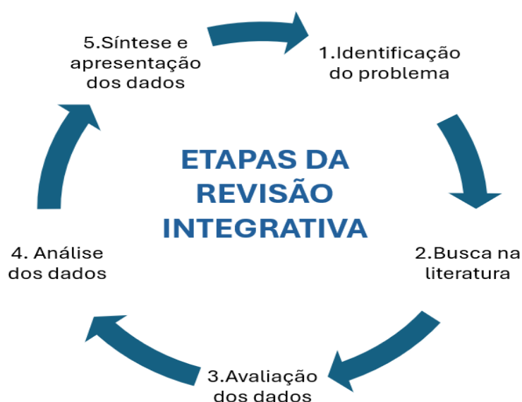
Figura 1 - Etapas da Revisão Integrativa

Fonte: Elaborado pelos autores, baseado no método proposto por Whitemore & Knafl, (2005)