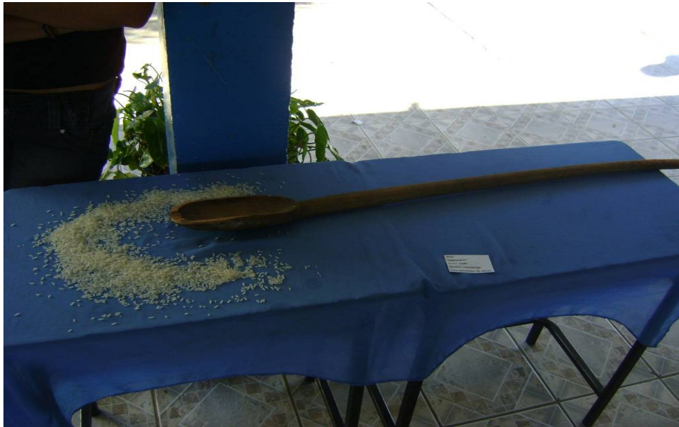
FOTO 14 – Mostra dos alunos do 2º ano do ensino medio. Autor: Wádson Rocha Fonte: Pesquisa de campo. Abr. 2011.

ampliou as possibilidades. Passaram a ver a arte não no sentido de ser contemplada e sim experimentada, permitindo interferência do espectador.