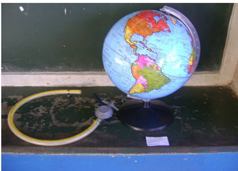
FOTO 4 – Obra “A necessidade urgente de água”. Autor: Wádson Rocha Fonte: Pesquisa de campo. Abr. 2011.