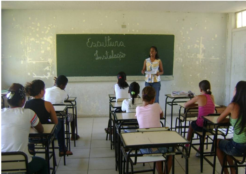
FOTO 1 – Explicação sobre o conteúdo. Autora: Isabella Lima Fonte: Pesquisa de campo. Abr. 2011.

Após discussões sobre o assunto, os alunos foram ao laboratório de informática pesquisaram os diversos tipos de escultura e instalação, seus autores, suas peculiaridades e observaram que há relação entre escultura e instalação, mas ambas têm suas especificidades. Houve discussão maior sobre as obras em instalação porque alguns alunos não concordaram que sejam esculturas. Mostrou-se, então, o que era comum entre as duas técnicas e em qual ponto diferenciavam. Em comum acordo, concluíram que o fruir em instalação contribui com maior liberdade de criação usando o espaço de acordo com os seus objetivos.