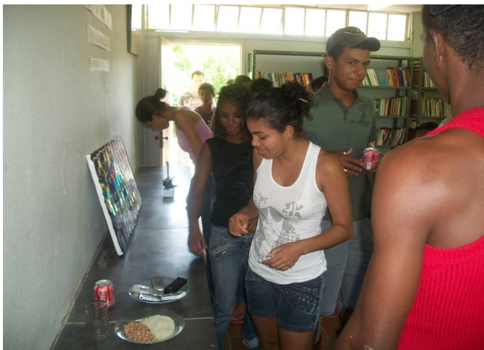
FOTO 13 – Alunos do 2º ano/médio observando a obra de seus colegas. Autora: Almira Rodrigues de Jesus Lima Fonte: Pesquisa de campo. Abr. 2011.

Usando instrumentos próximos aos alunos da escola, estes criaram suas obras em diferentes espaços do local. Com clareza foi percebido e levado em conta na construção de suas obras, conhecimento, fruição e criatividade.