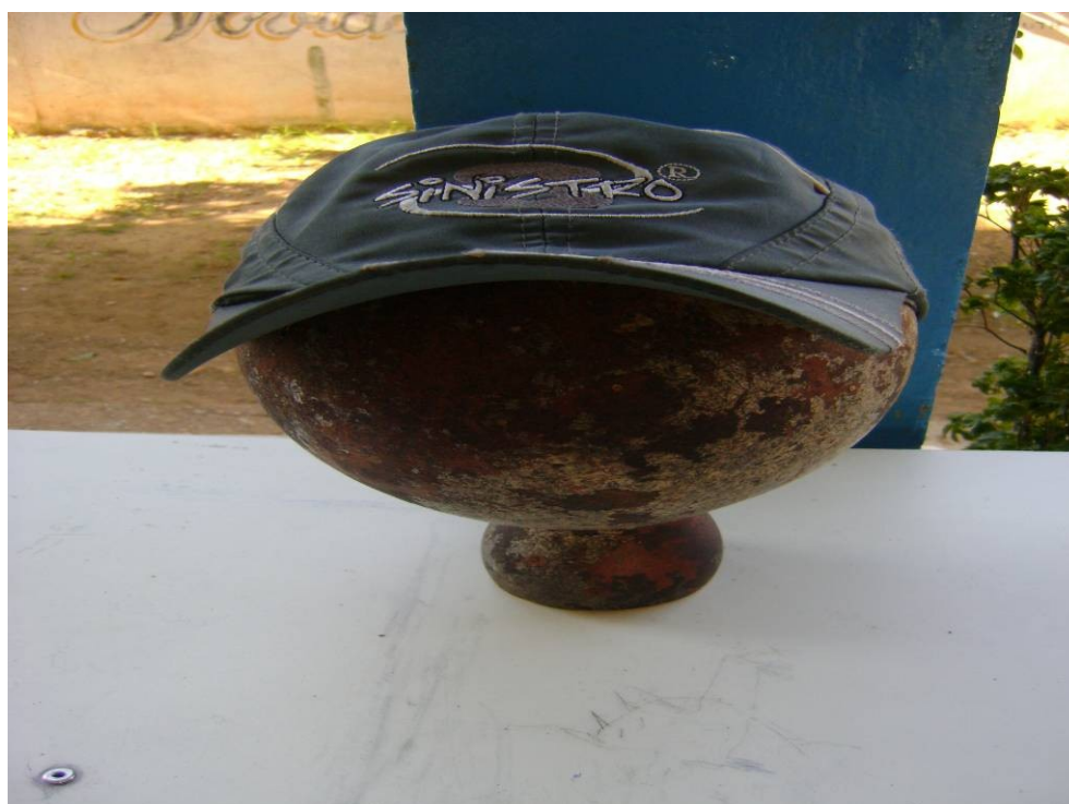
FOTO 19 – Destaque da obra “Mentes vazias” – Alunos dos 2º ano/médio. Autor: Wádson Rocha Fonte: Pesquisa de campo. Abr. 2011.

Todos os atos humanos são determinados por datas e horas, tornando-os escravos do tempo. Quando não há cumprimento desta ordem desorganizam suas atividades (foto 18).