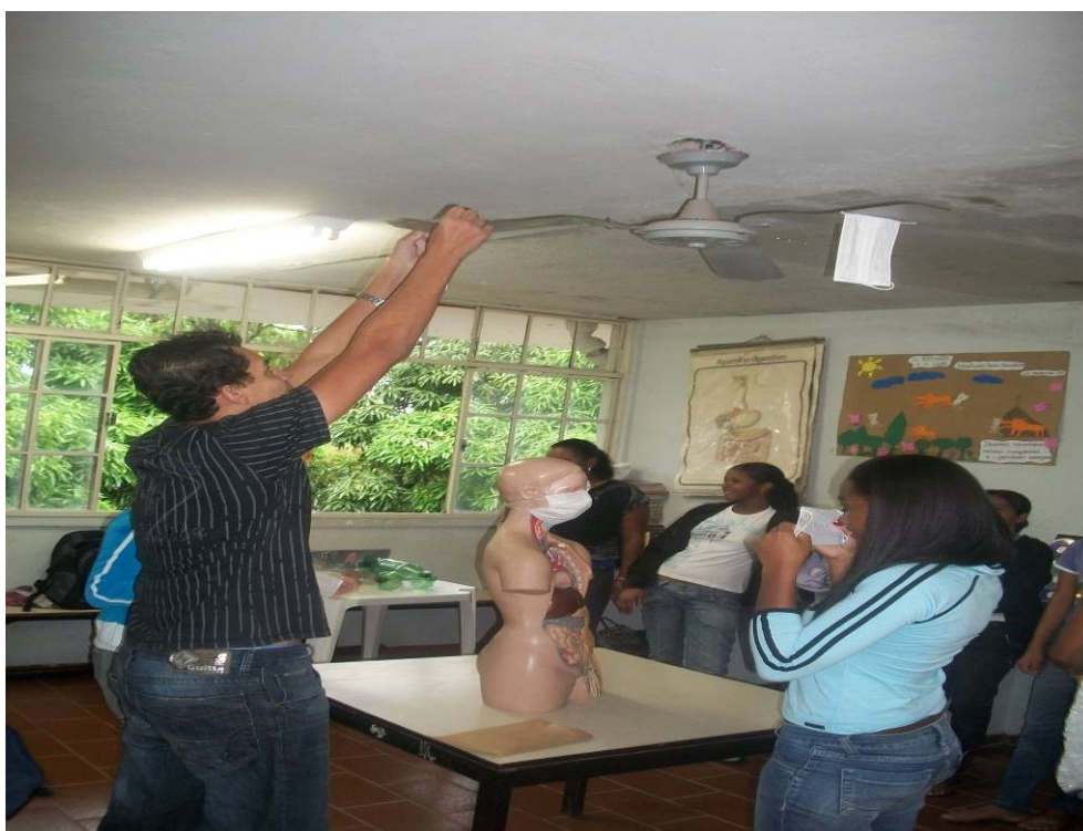
FOTO 12 – Criação de obras em instalação pelos alunos do 2º ano/médio. Autora: Almira Rodrigues de Jesus Lima Fonte: Pesquisa de campo. Abr. 2011.

“Através da arte, expresso o que entendi de vários assuntos”. (L. A. O. A. –17 anos).