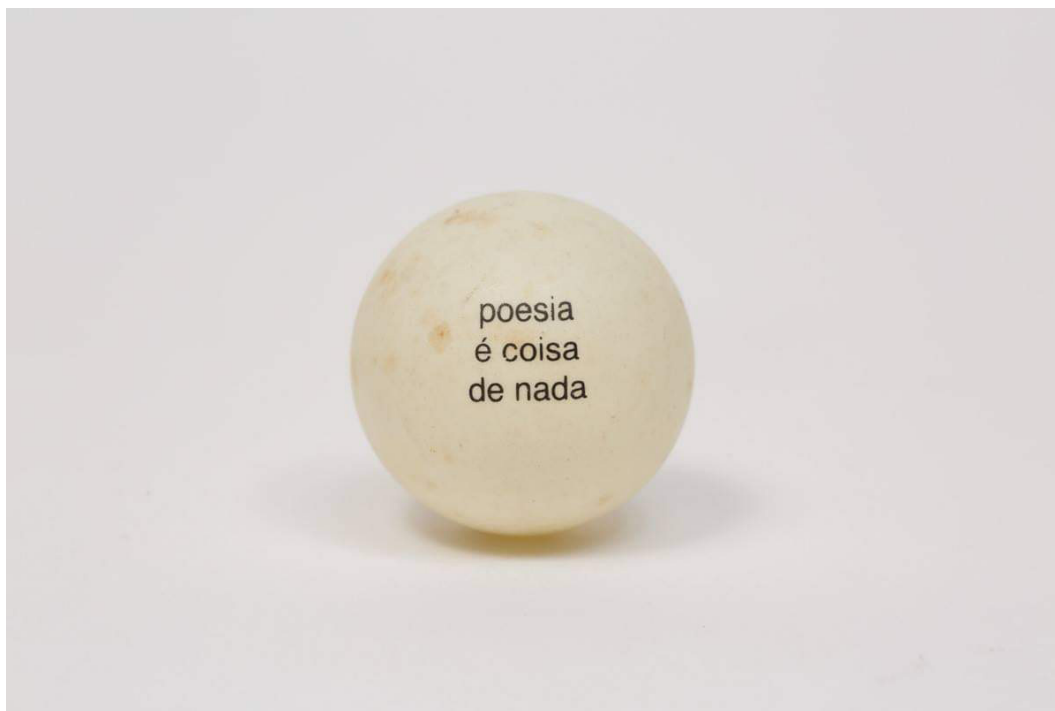
FIG. 4. Lenora de Barros, Poesia é coisa de nada , 1990.

galerias de arte. A palavra escrita ou falada é frequente em seus trabalhos, como Poesia é coisa de nada , uma bola de pingue-pongue com texto em leterset, de 1990 [Fig.4].