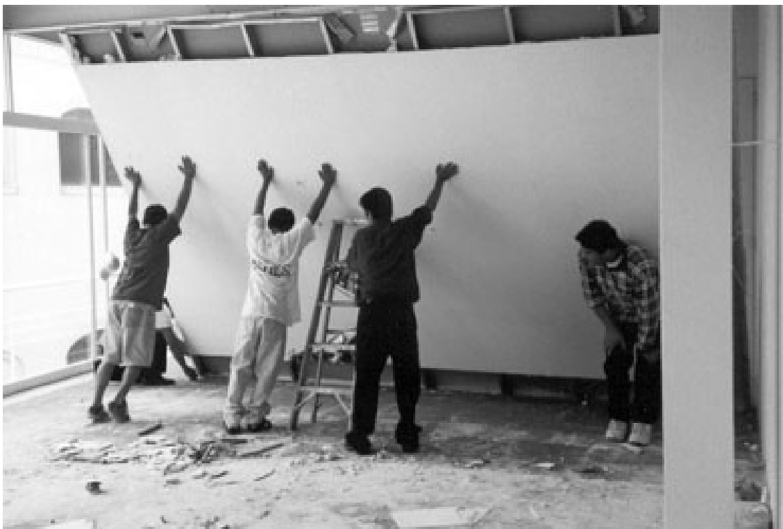
FIG. 1. Santiago Sierra, A parede de uma galeria removida, inclinada sessenta graus do chão e sustentada por cinco pessoas , 2000. Fonte: https://www.santiago-sierra.com/20006_1024.php .

Usados para nomear uma série de obras que compartilham algumas características formais ou conceituais, os títulos também podem ser genéricos, uma palavra ou frase que aponta para um aspecto comum de todas as obras que formam o conjunto. As numerosas Cenas de um filme sem título , de Cindy Sherman, criadas entre 1977 e 1980, são autorretratos encenados, em referência aos estereótipos dos personagens femininos no cinema, enquanto as Esculturas Anônimas do casal Hilla e Bernard Becher são fotografias de estruturas industriais abandonadas que ganharam o prêmio de escultura da Bienal de Veneza em 1990.