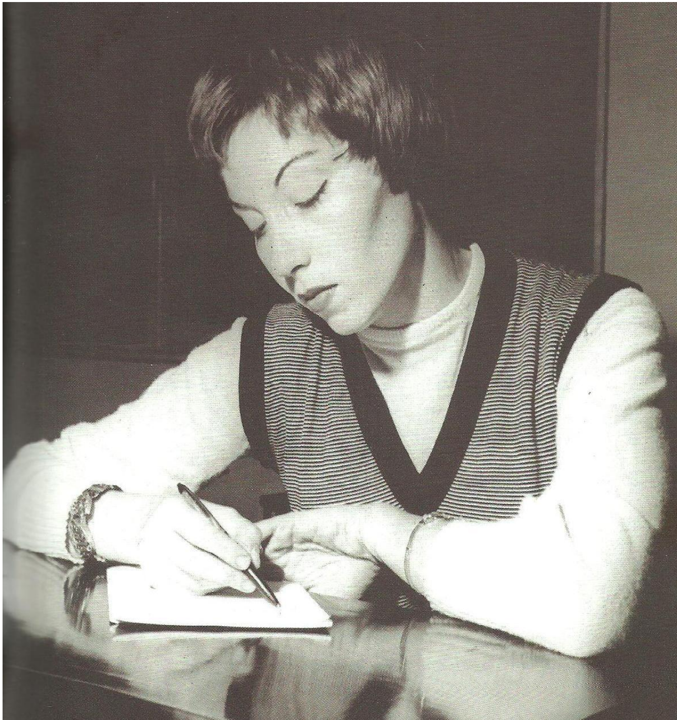
Fotografia 2 – Amor