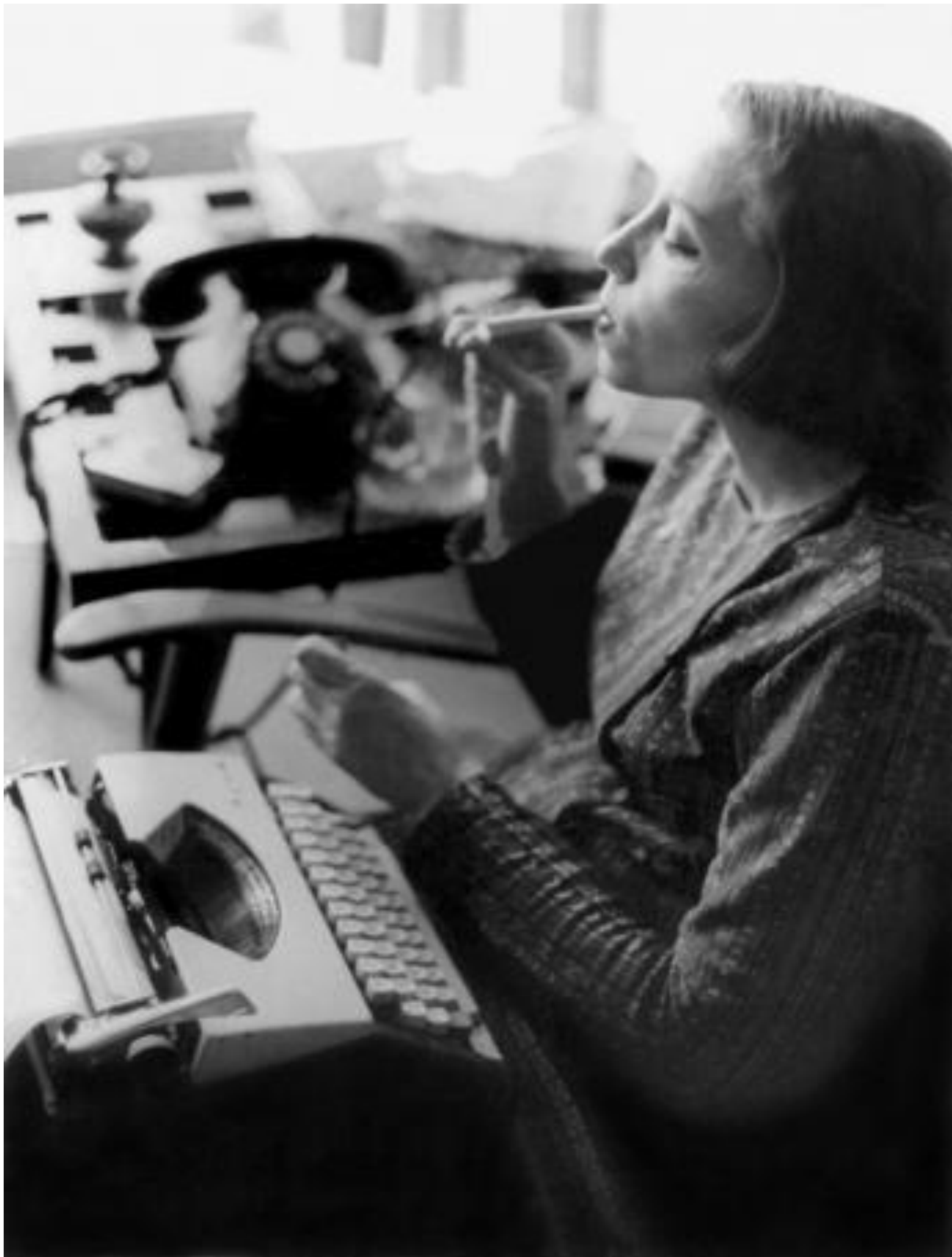
Fotografia 4 – Máquina de escrever