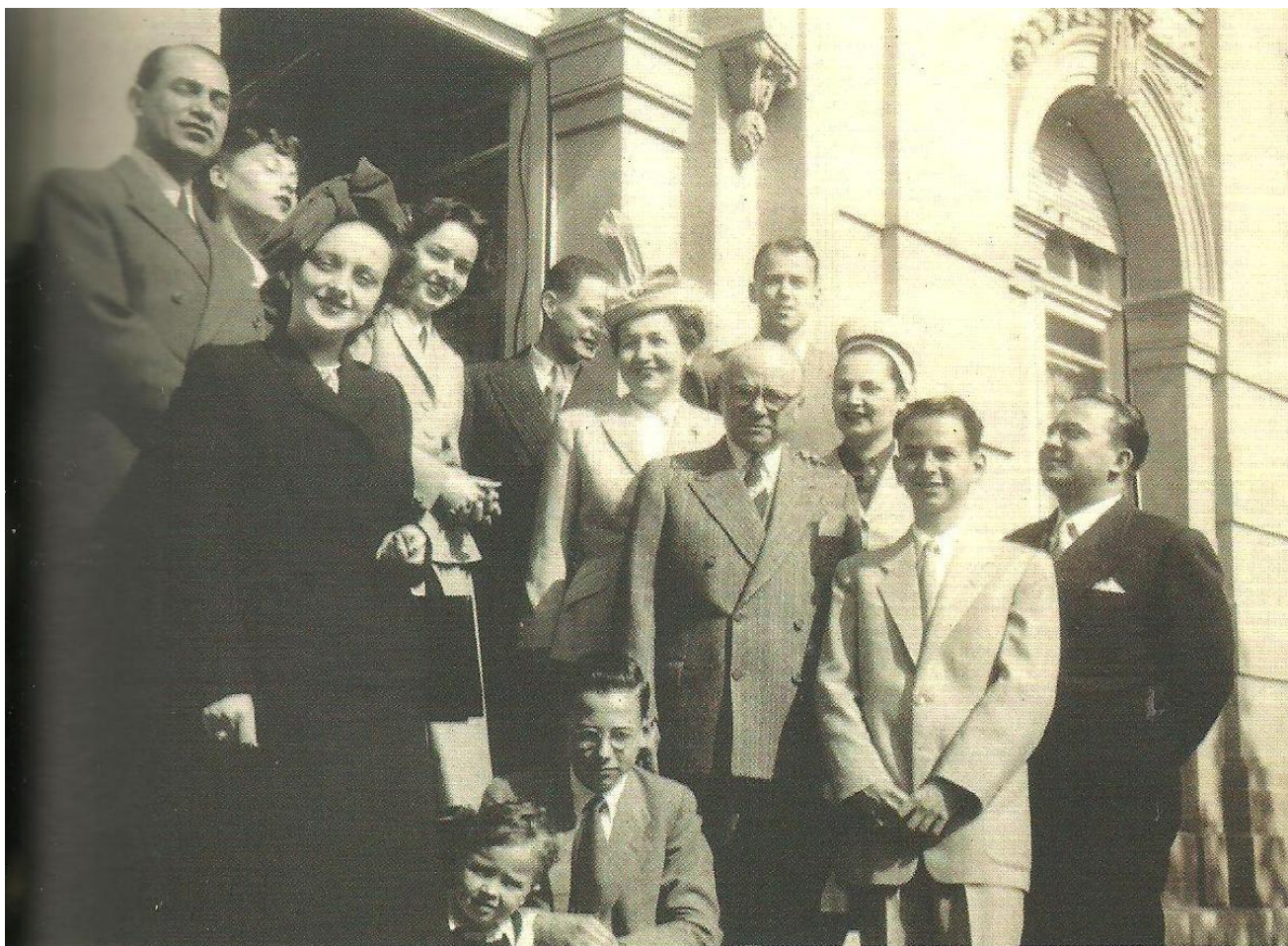
Fotografia 5 – Olhar