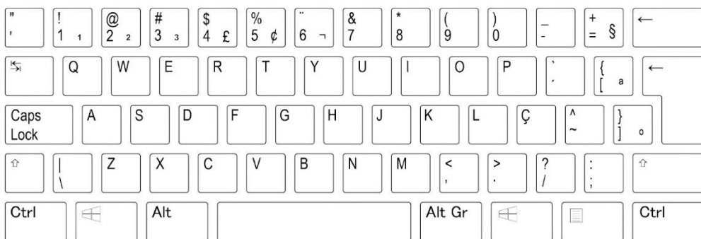
Figura 1 – Teclado modelo ABNT-2.

Já os arranjos: {1,1}, {1,2}, {1,3} e {2,1}, foram, automaticamente, classificados como não semelhantes e não passíveis de pareamento, uma vez que pelo menos um dos bigramas pertence a uma classe de baixa frequência. Por outro lado, os bigramas que apresentaram o arranjo {2,2}, passaram por uma inspeção cuja análise levou em consideração a distância entre as teclas dos caracteres em um teclado ABNT-2 (Figura 1). Para essa análise, arbitrou-se a geometria quadrada para as teclas, tomando como referência a distância normalizada de 1 unidade do centro de uma tecla a outra. Por exemplo, considerar-se-á a distância entre as teclas A e S como 1, entre A e D como 2, entre A e W como 1,2 e, assim, sucessivamente.