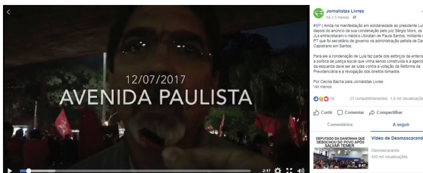
Figura 6: post produzido 1 (vídeo)