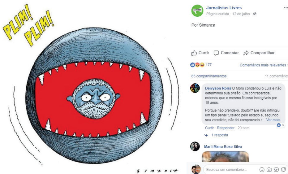
Figura 1: post compartilhado 1 (charge).