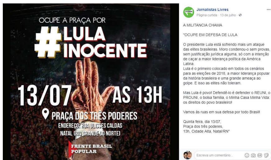
Figura 3: post compartilhado 3 (cartaz).