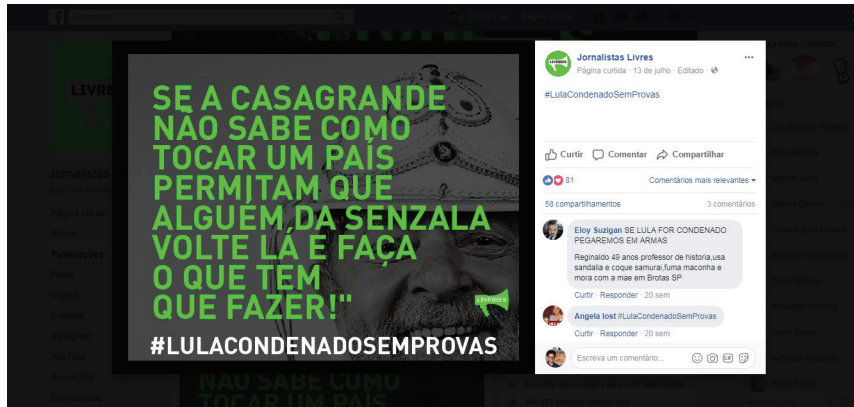
Figura 7: post produzido 2 (figura editada).