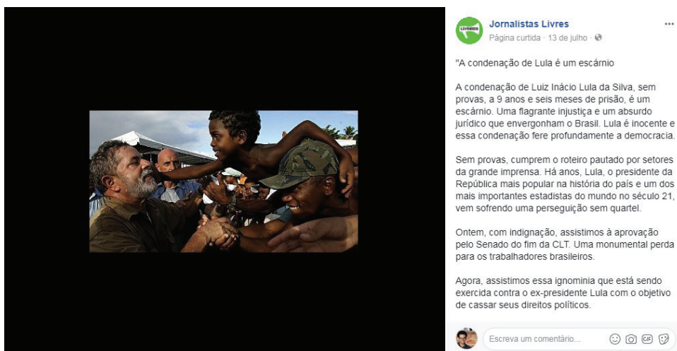
Figura 2: post compartilhado 2 (texto).