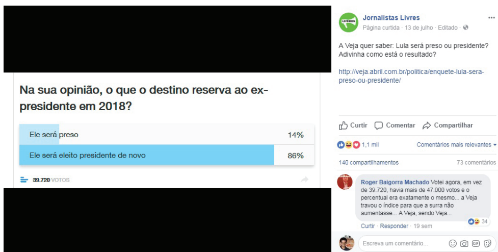
Figura 4: post compartilhado 4 (enquete).