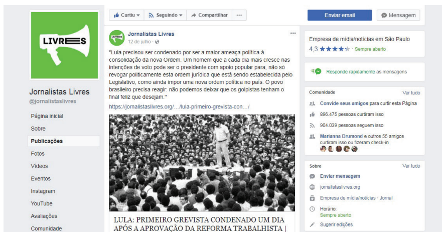
Figura 8: post produzido 3 (texto).