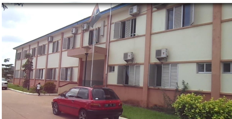
Figura 1: Escola do Lombo-Lombo

Na experiência de realização dessa dissertação ressalto a oportunidade significativa de ampliar o meu contexto de conhecimento e de capacidade de análise. Senti o quanto é importante e complexo a exposição de um trabalho científico. O nosso desejo é que o esforço empreendido nesse trabalho possa contribuir para as reflexões posteriores sobre a educação de jovens do ensino noturno em Angola.