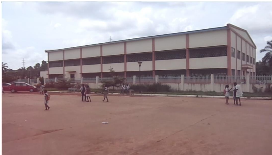
Figura 2: A escola do Lombo-Lombo numa outra perspectiva

portanto a estrutura foi acolhendo os alunos, trabalhou-se mas depois de um determinado tempo por motivo da população crescer havia mais crianças então houve a necessidade e também porque a estrutura já não dava resposta as necessidades da escola no que diz respeito ao número de crianças. Então construiu-se uma escola maior e a partir de 2008 voltamos para a estrutura antiga nova e hoje acolhe mais alunos não só no ensino regular que é o ensino que é feito durante o dia, mas, também no ensino noturno.