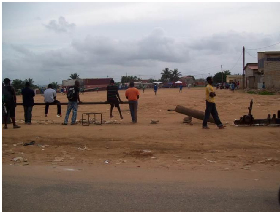
Figura 4: Jovens de Cabinda em campo de futebol