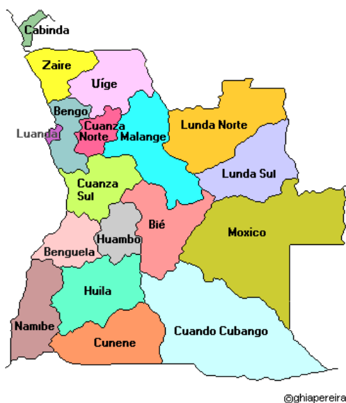
Mapa 1 – Mapa Político e Administrativo de Angola