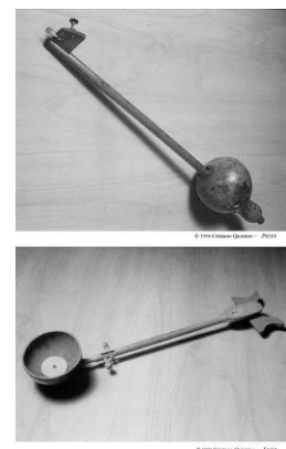
Figura 2 – Instrumentos feitos com materiais naturais. Peixe e Flôr .