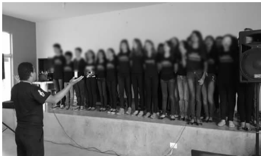
Figura 6- Apresentação do Coral Cantarte . Execução da música: Planeta Azul, em 17/05/2015, na Escola Estadual Tancredo Neves, Taiobeiras/MG.