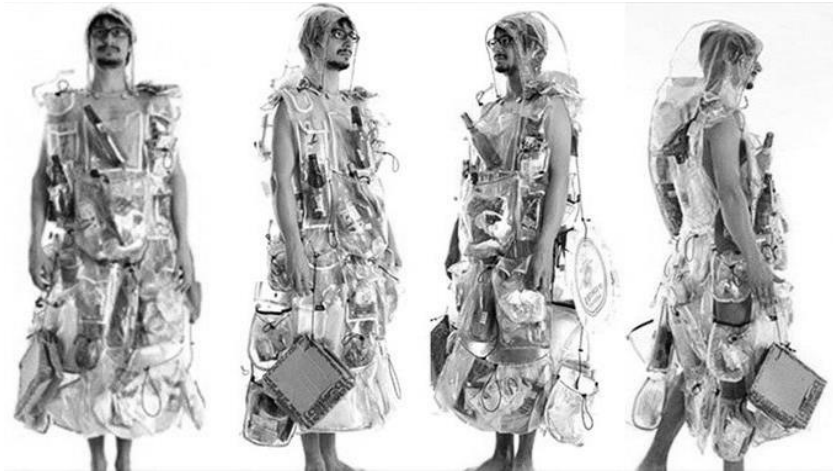
Figura 4 – Refluxo . Peri Pani. 2003

caso de São Paulo, em 2003, Rio de Janeiro, em 2012, São José dos Campos, em 2015), mas em outros países como Espanha (Barcelona, 2006), Itália (Nápoles, 2009) e República Tcheca (Praga, 2009). (CRUZ, 2018).