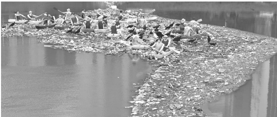
Figura 3 - Caiaques . Eduardo Srur. 2006.

Na área das artes visuais destacam-se; Eduardo Srur e Peri Pane. Srur é conhecido por suas obras que provocam pensamentos ambientais. Um dos trabalhos mais conhecidos do artista é a intervenção Caiaques (fig.3), realizada no ano de 2006 no Rio Pinheiros, em São Paulo. A obra consistiu em uma instalação com dezenas de caiaques de várias cores tripulados por bonecos. Os caiaques flutuam em meio as águas poluídas do rio Pinheiros, em São Paulo. O objetivo da obra foi chamar a atenção para o volume de lixo no rio e a necessidade de ações efetivas para combater esse descarte. A importância do trabalho de Eduardo Srur para as questões ambientais está no fato de que suas intervenções artísticas são capazes de provocar reflexões profundas que envolvem também os papéis governamentais locais na defesa e preservação ambiental. (WIKIPÉDIA, 2023; SRUR, Eduardo, 2023).