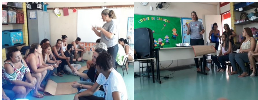
Figura 2 - Explicando a dinâmica

Para a realização da dinâmica foi utilizado o Kraft, com objetivo de coletar as representações dos participantes sobre os desejos, anseios, interações com a escola e seu ambiente. Foram disponibilizados materiais como revistas, jornal, cola, canetinhas, pincéis e tinta. Cada grupo foi direcionado para o Kraft, onde os grupos tiveram 5 minutos para conversarem sobre a pergunta e expressarem suas respostas através de palavras, desenhos ou colagens, após os cinco minutos os grupos trocavam o cartaz (Kraft) até que todos os grupos respondessem as três perguntas. Foi elaborado um painel comentado com a produção de todos.