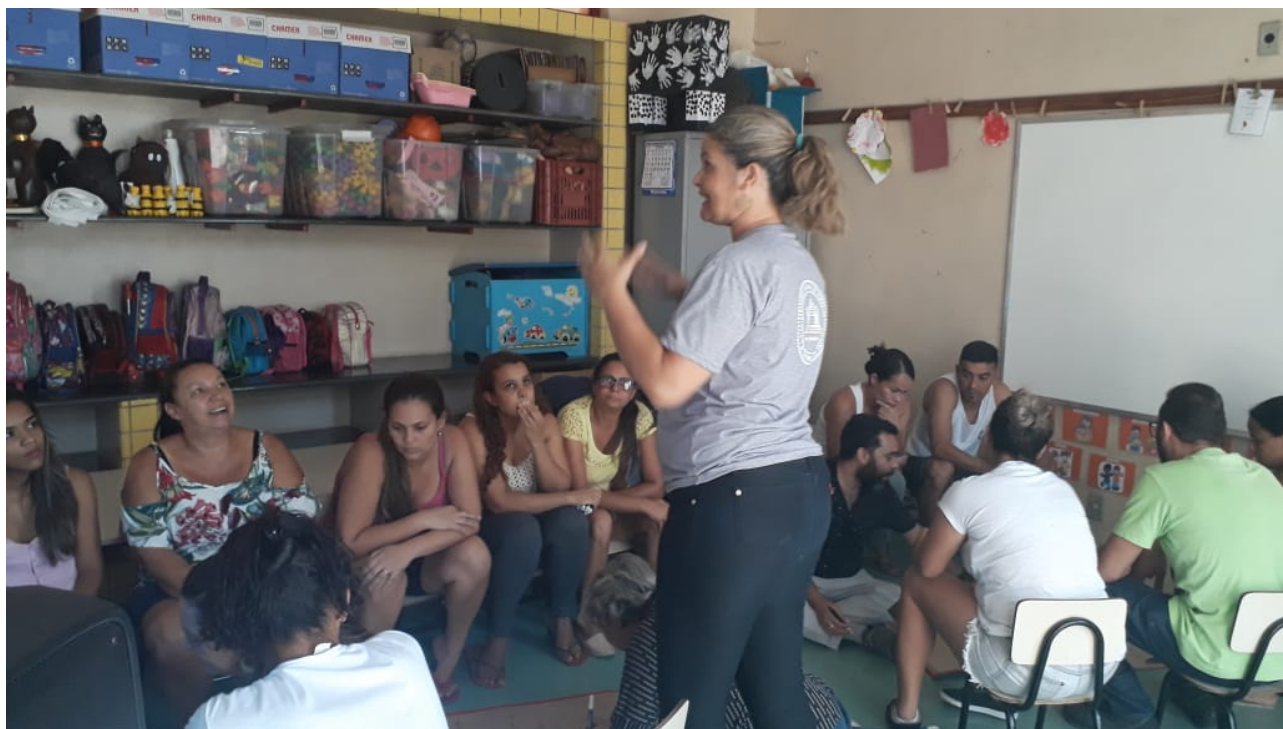
Figura 1 - Reunião com as famílias