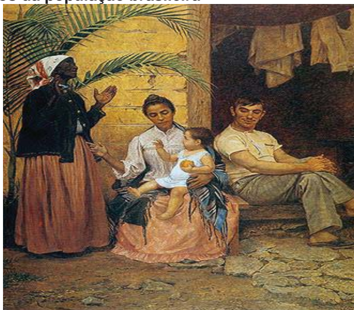
A Redenção de Cam – Modesto Brocos 2

Em 13 de maio 1888 foi sancionada a Lei Áurea, determinando o fim da escravidão no Brasil. O processo de abolição da escravatura foi gradual e começou em 1850, com a Lei Eusébio de Queirós, prosseguindo com a Lei do Ventre Livre, a