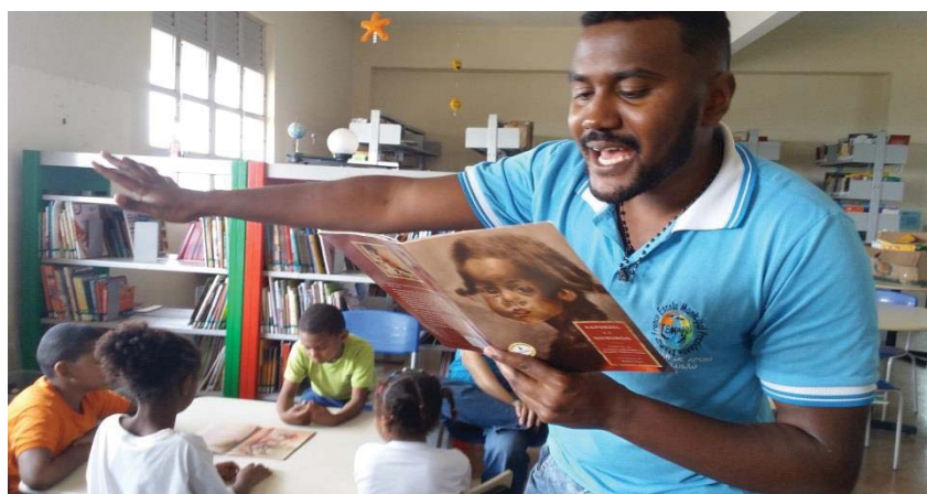
Figura 2-Acervo pessoal da autora

A data escolhida foi dia 22 de agosto, uma quinta-feira, dentro do horário já usual de visitação dessa turma à biblioteca. Por volta das 14:10 vieram cerca de 26 alunos e alunas, demos início à contação de história do livro escolhido e coloquei em cada mesa quatro exemplares, para que acompanhassem a narrativa e as ilustrações, que são muito bonitas. Durante a contação, percebi o quanto a turma se envolveu através dos comentários, das risadas e das expressões faciais.