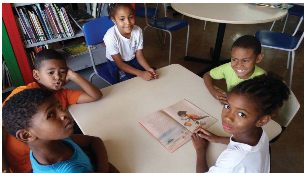
Figura 3-Acervo pessoal da autora.

A professora teve que intervir e estimulou a continuação da conversar, procurando desconstruir o ideal de beleza que nos foi, por tantos anos, imposto pela mídia e pela sociedade em geral. Esse discurso insiste na ideia de que belos são somente aqueles que possuem características da “beleza europeia” e tudo o mais que foge a essas características não tem beleza nem valor. “A ideologia, ao promover o estereótipo, leva o estereotipado a internalizar sua imagem negativa, idealizada com o objetivo de inferiorizá-lo e oprimi-lo.” (CAVALLEIRO, 2006, p. 63). Situações que aparentam ser uma “simples algazarra de criança”, como por exemplo: dissimulações, piadinhas quanto à aparência do cabelo, o formato do nariz, a cor da pele e o “cheiro” da criança negra, muitas vezes encobrem o racismo oculto, abrindo as portas para manifestar ideias preconceituosas.