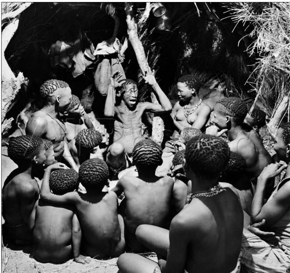
Figura 2: Griot