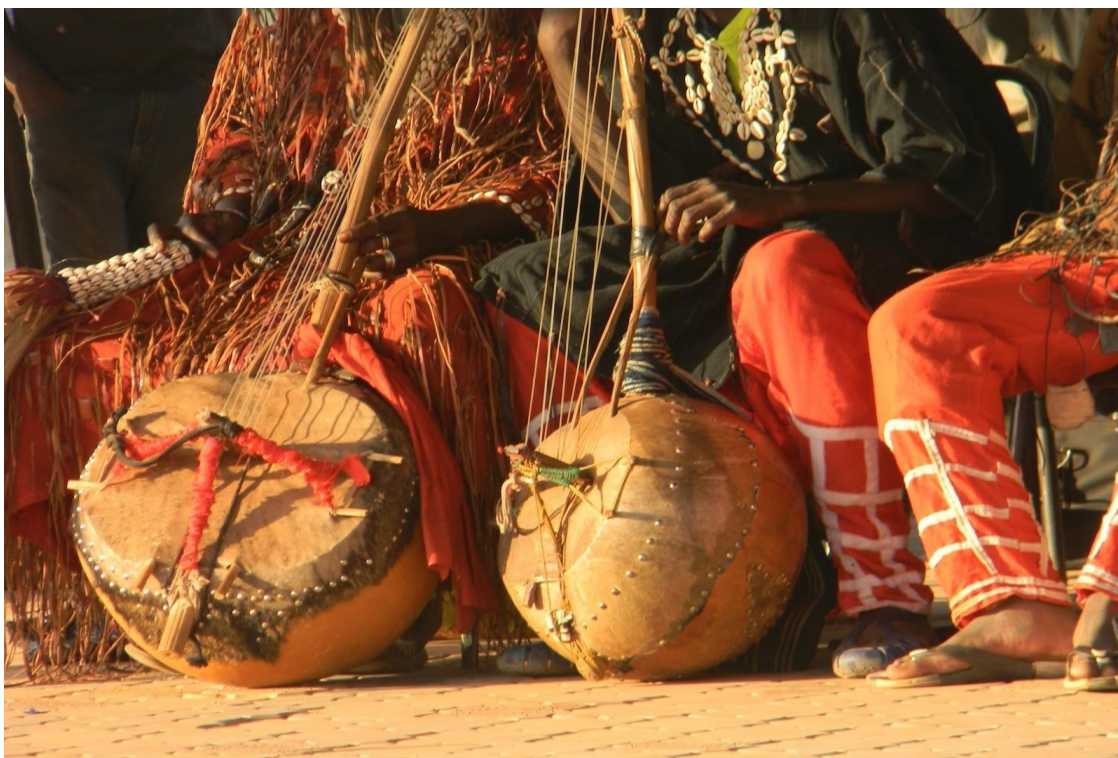
Figura 3: Tambores

A dança não se desenvolve sem o tambor, que é a escrita sonora que o dançarino deve acompanhar ao ler, ouvindo, seu ditado. A escritura do tambor, diz Jahn, citado por Montiel (1999, p.32), “pode difundir mais rapidamente que a escrita gráfica”. Para compreender o valor semântico do tambor, é necessário remeter-se às línguas africanas, que são estratos sonoros que dão às palavras um significado diferente, conforme a gravidade sonora das vogais.