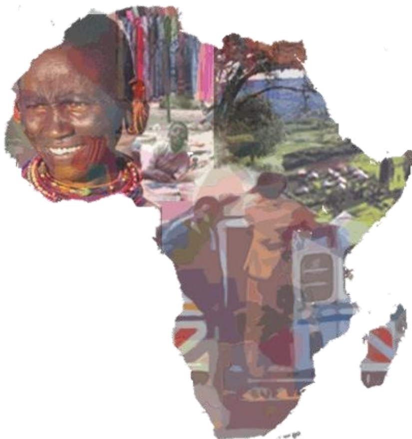
Figura 1: Mapa da África

Palavras que tomaram o poder de uma referência diante de um povo que não pôde se alfabetizar, servindo como objeto de estudo e respeito perante a uma pessoa com o dom de discursar. Este livro que ficou guardado na memória de quem era indicado para reter conhecimentos.