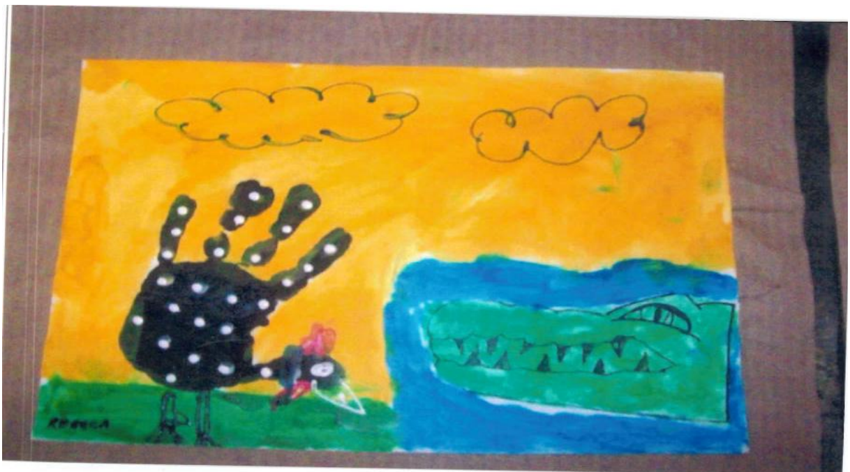
Foto 4 – Produção oficina de artes “Krokô e Galinhola” um conto africano Burundi.

Iniciou as atividades com a roda de história, com o conto africano Burundi Krokô e Galinhola, o conto foi muito apreciado pelas crianças que permaneceram atentas para o desenvolvimento do conto, elas divertiram muito com a esperteza de galinhola, uma galinha de angola, que tece uma história para se safar de ser devorada pelo faminto Krokô, um crocodiliano que habita as margem do Rio Luvironza.vide