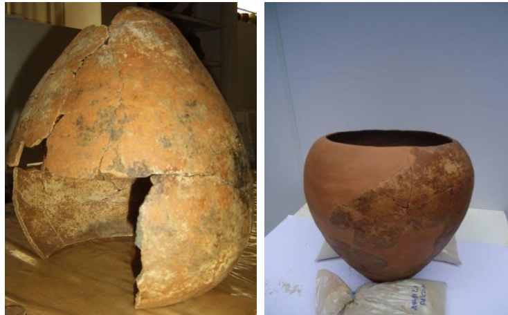
Figura 1- Fragmentos e reconstituição da urna encontrada em 2009, nas terras Xacriabá. Fotos: João Cristeli – 2009

Também em 2009, um grupo de professores/as e estudantes da Escola de Belas Artes da Universidade Federal de Minas Gerais (EBA/UFMG), buscando lugares diferentes para realizar queimas alternativas de cerâmica, ficou sabendo que dentro do próprio Campus da Pampulha, sede da universidade, na área da Estação Ecológica, havia um forno antigo desativado. Na primeira visita ao espaço, o grupo ficou conhecendo o forno, construído em 1955, como parte de um projeto de uma Olaria (Figura 2) construída no local como fonte de recursos para a manutenção do Lar dos Meninos Dom Orione, uma instituição filantrópica.