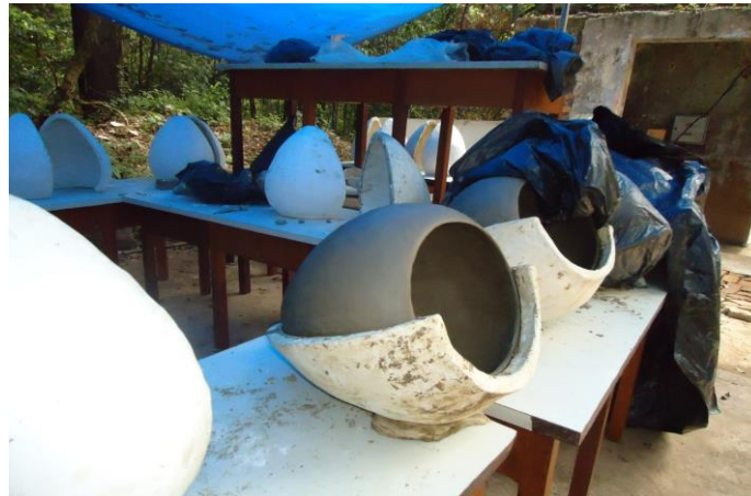
Figura 6– Reproduções do objeto.

As queimas das peças (Figura 7) foram realizadas em fogueiras e em um forno Anagama 5 , esta no ateliê de Adel Souki, em Brumadinho, na região metropolitana de Belo Horizonte, com a participação dos Xakriabás e Pataxós, de alunos do curso de Licenciatura Indígena (FIEI/UFMG), dos integrantes do Grupo de Pesquisa e convidados.