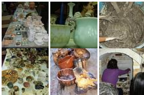
Figura 3 - Registros de algumas das ações do projeto 'Cerâmica: Uma Proposta Contemporânea'.