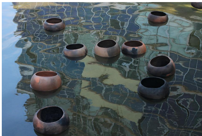
Figura 4 – Detalhes da instalação ‘Cerâmica, Territórios Cruzados’, no lago em frente ao prédio da reitoria da UFMG, no Campus Pampulha.

Cerâmica, territórios cruzados – Nas necessárias pausas, na construção de novos olhares para os caminhos percorridos, é possível perceber que os entrelaçamentos desses momentos, quase simultâneos, - o projeto Artista Visitante, o contato com o forno da antiga Olaria e o trabalho realizado a partir dos fragmentos arqueológicos da cerâmica Xacriabá – se desdobraram em outros tantos percursos, individuais e/ou coletivos. E no re-conhecimento da “potência política, pedagógica, histórica, estética e poética dos inícios” , a instalação ‘Cerâmica, territórios cruzados’ (Figura 4) se configura como uma espécie de amalgama desses inícios vividos e de outros inícios em construção.