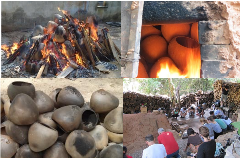
Figura 7– As diversas queimas realizadas

As queimas das peças (Figura 7) foram realizadas em fogueiras e em um forno Anagama 5 , esta no ateliê de Adel Souki, em Brumadinho, na região metropolitana de Belo Horizonte, com a participação dos Xakriabás e Pataxós, de alunos do curso de Licenciatura Indígena (FIEI/UFMG), dos integrantes do Grupo de Pesquisa e convidados.