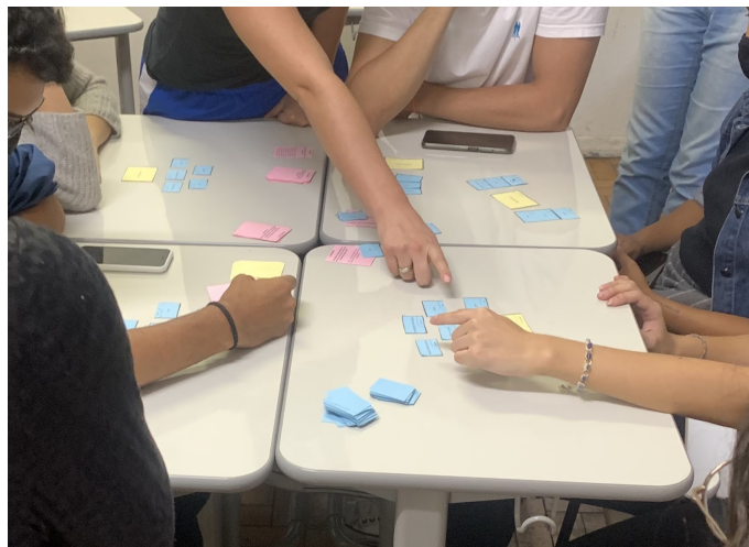
FIGURA 5: Jogo desenvolvido por estudantes da disciplina “Assessoria Técnica - uma prática em movimento” para o reassentamento da Ocupação Manoel Aleixo.

A principal sacada da dinâmica foi a de misturar atores hegemônicos com atores que usualmente não são pensados como desse circuito, sem fazer juízo de valor com relação a sua utilização, mas com a possibilidade de despertar debates sobre as implicações de cada uma delas, entendendo as suas contradições e potencialidades ( FIG. 5).