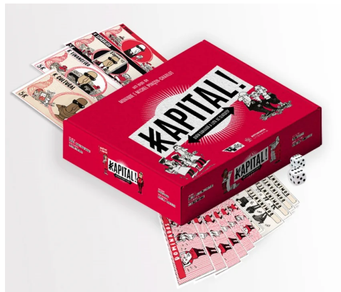
FIGURA 2: Jogo Kapital.

Para a construção desses jogos-cartográficos, os alunos foram apresentados a alguns outros jogos existentes. Em uma das aulas, dedicada a isso, eles dividiram-se em grupos e passaram a tarde jogando o “Kapital!: quem ganhará a luta de classes?” e o “oKupa: Juventude, Cidadania e Ocupação da Cidade” (FIG. 2 e FIG. 3). Cada um desses jogos têm propostas, modos de jogar e mecânicas diversas, o que foi interessante para sensibilizar os alunos que, adiante, criariam seus próprios jogos em conjunto. Na criação dos alunos, foi possível perceber reflexos desses dois jogos apresentados e jogados em aula, como também as perguntas disparadoras do método cartográfico, estudado na primeira atividade.