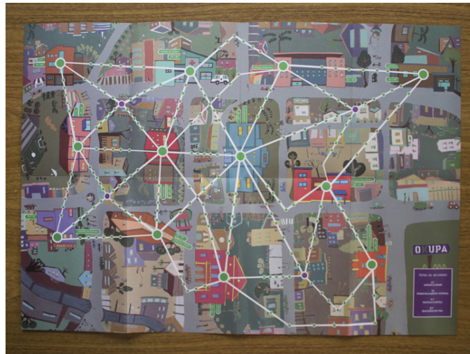
FIGURA 3: Jogo Okupa.