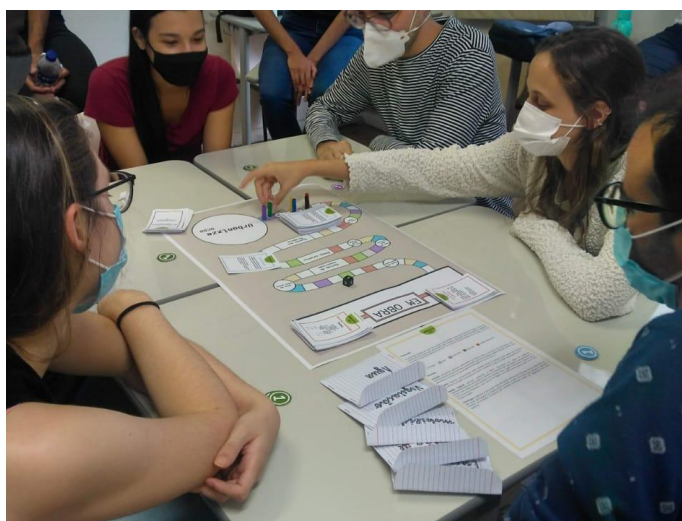
FIGURA 66: Jogo desenvolvido por estudantes da disciplina “Assessoria Técnica - uma prática em movimento” para a Ocupação Cidade de Deus.

e depois poderiam ser questionadas e avaliadas pelos demais jogadores, configurando por votação a pontuação. Existe também um componente de construção no jogo, realizado a partir das moedas que os jogadores conseguem ao responder às perguntas. Esse jogo, como os outros, é fortemente pautado na construção de diálogos problematizadores, que levam a discussões, consensos e dissensos sobre a produção do espaço, a partir de determinados recortes orientadores (FIG.6).