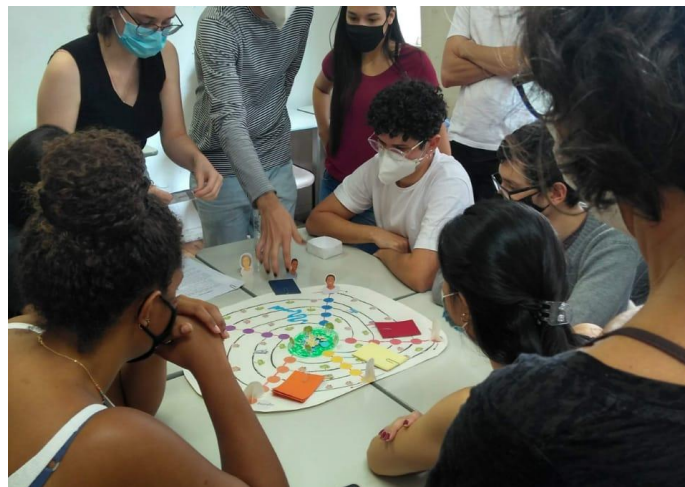
FIGURA 4: Jogo desenvolvido por estudantes da disciplina “Assessoria Técnica - uma prática em movimento” para o Vale das Ocupações do Barreiro.

Ao final, existia um enigma mais complexo, que deveria ser solucionado conjuntamente. A cor-categoria que tivesse menos estrelas seria a orientadora da pergunta desse enigma. Essa estratégia foi pensada para atacar as fragilidades argumentativas percebidas ao longo da partida. Dessa forma, se o eixo transitar obteve menos estrelas, por exemplo, ele provavelmente foi o que o grupo menos conseguiu elaborar conjuntamente ao longo da partida. Assim, no final ele seria retomado, proporcionando uma auto-reflexão entre o grupo ( FIG.4).