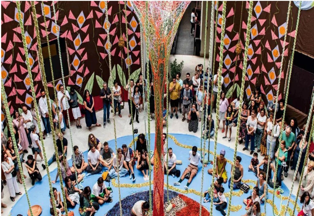
Figura 5 - Fly Gloup Nave / Ernesto Neto.