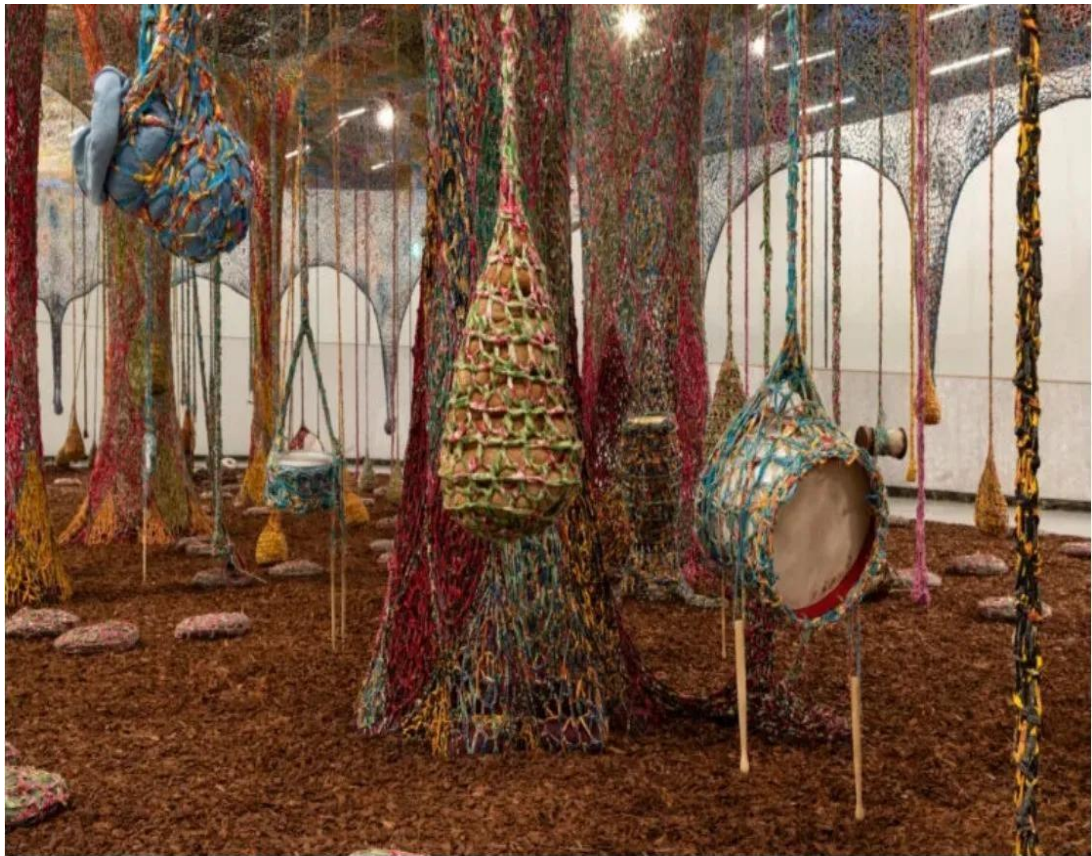
Figura 7 - Nosso Barco Tambor Terra / Ernesto Neto.