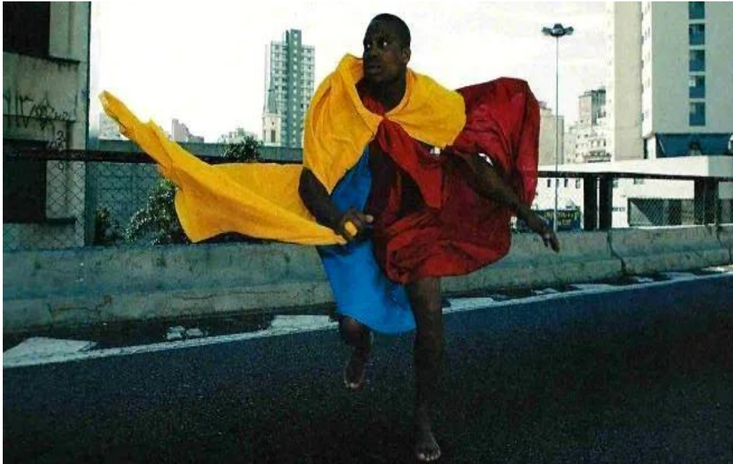
Figura 3 - Parangolé /Hélio Oiticica