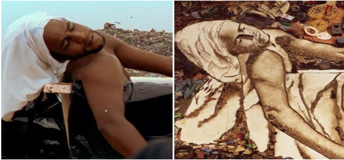
Figura 10 - Lixo Extraordinário / Vik Muniz.