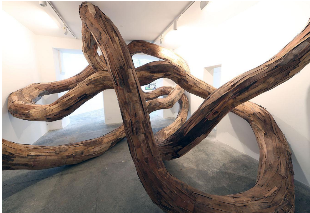
Figura 1- Ouroboros - Henrique Oliveira

objetos reaproveitados, criando assim uma conexão entre ser humano e meio ambiente e Vik Muniz, cujas as produções apontam inúmeras formas de diálogos, constrói imagens complexas utilizando materiais inusitados e em seus trabalhos, como açúcar, terra, provocando reflexões sobre o valor da arte.