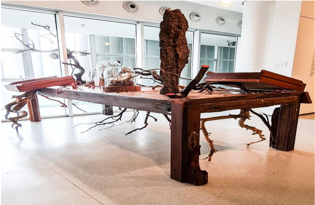
Figura 9 - Série Zona da Mata / Rodrigo Bueno.