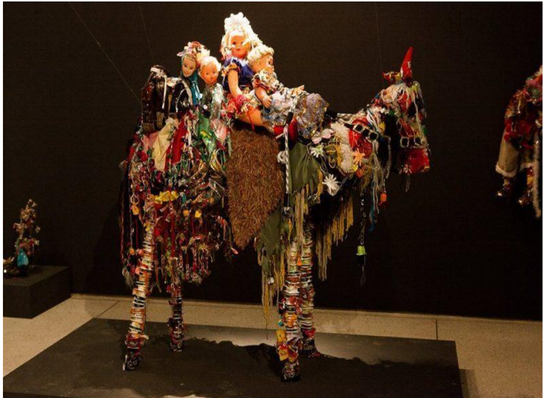
Figura 8 - Guinea e as Três Marias / Efigênia Rolim.