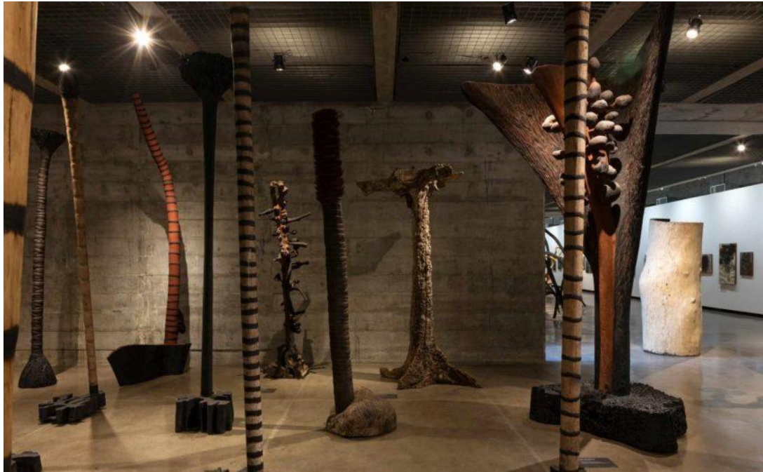
Figura 14 - Escultura / Franz Krajcberg.