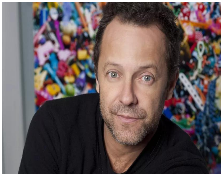
Figura 13 - Vic Muniz.

Essa fusão entre o lúdico com a utilização de materiais reciclados nas obras de artistas como Efigênia Rolim, Rodrigo Bueno e Vik Muniz são exemplos fortes dessa tendência. Esse ponto de vista, além de desafiar as fronteiras desses processos criativos, também tem como objetivo a promoção e reflexão profunda a respeito do consumo, o descarte e a sustentabilidade ambiental.