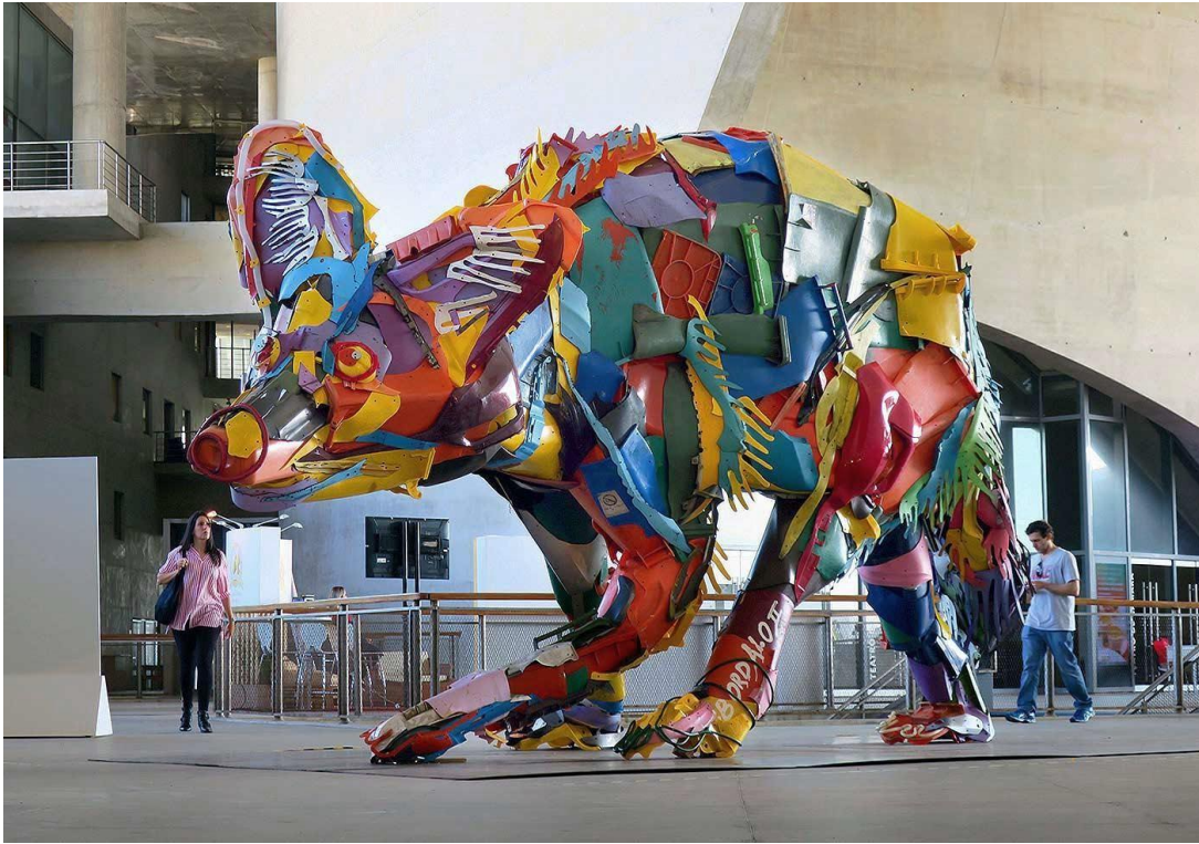
Figura 15 - Big Trash Animals / Bordaloii.