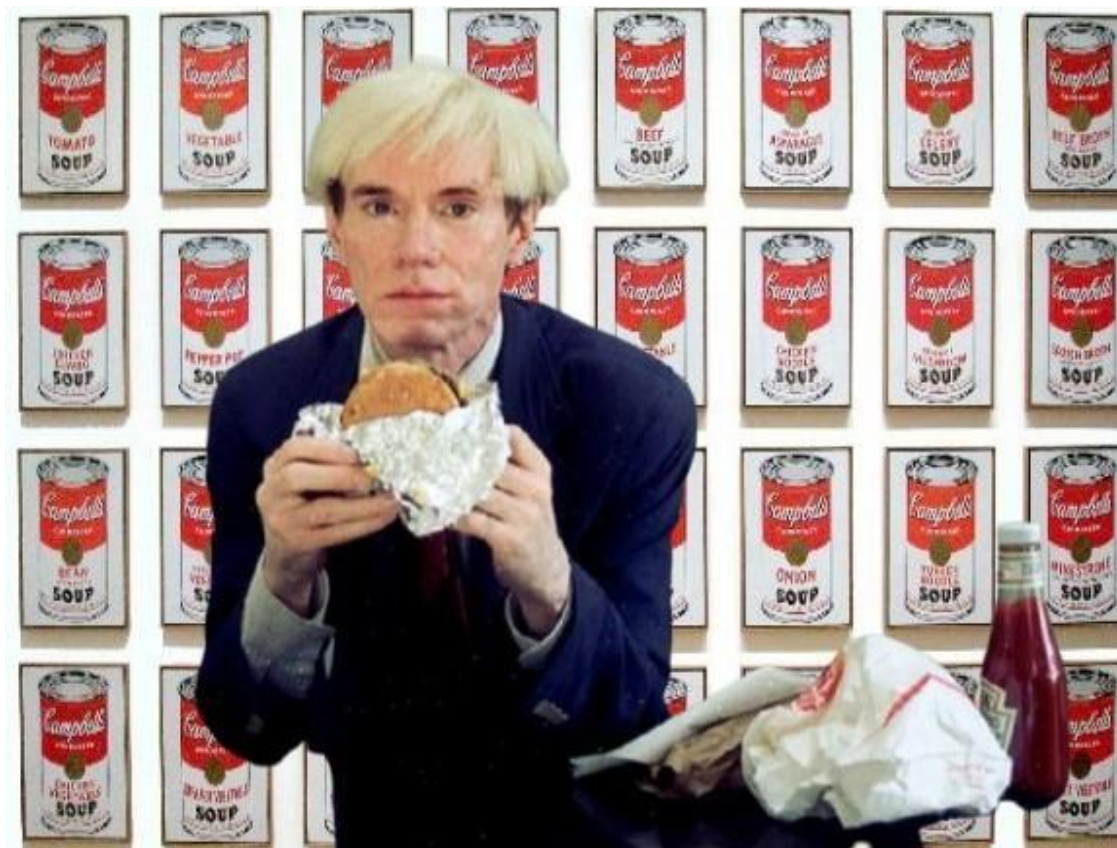
Figura 2 – Assemblagem digital - imagem de Andy Worhol