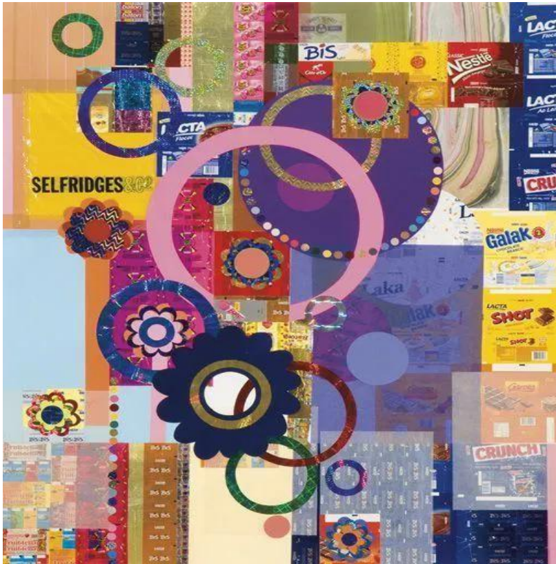
Figura 6 - Sonho de Valsa / Beatriz Milhazes

A ideia de arte como jogo não é de hoje, há tempos ela vem caminhando e sendo explorada por diversos artistas brasileiros, ganhando força através dos artistas neoconcretistas. A ludicidade se manifesta de diversas formas e jeitos na arte contemporânea, através das esculturas interativas, das instalações artísticas, performances, por exemplo, que nos trazem diversos desafios sobre o tradicional na arte.