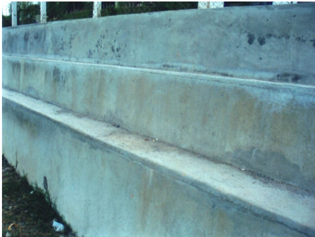
FIGURA 8 – Utilização de agregado reciclado - Meio fio ERE Pampulha