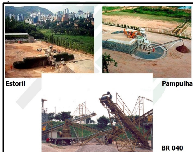
FIGURA 6 - Estações de Reciclagem de Entulho de Belo Horizonte

Para evitar a pressão sonora, as calhas dos equipamentos britadores são revestidas de borracha e as pás-carregadeiras dispõem de silenciadores.