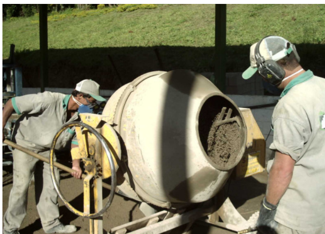
FIGURA 12 - Trabalhadores do Projeto Ecobloco

Tal projeto engloba três vertentes: a social, ecológica e empreendedora. Socialmente trabalha a inserção da população de rua no grupo de produção, uma vez que moradores de rua ganham a vida transformando entulho em artefatos. Permitindo assim, desenvolver no seu público alvo capacidade de prover seu sustento e de sua família numa perspectiva emancipatória.