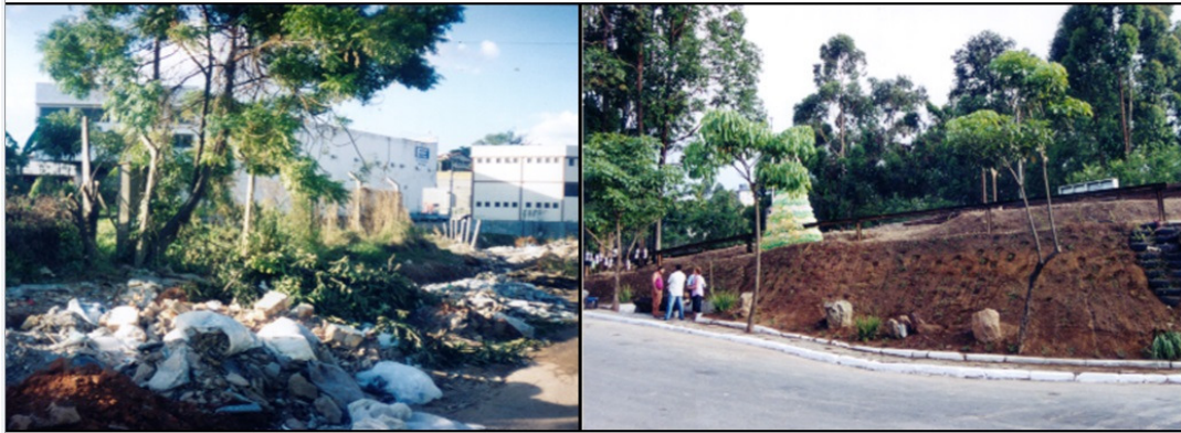
FIGURA 18 - Ação do subprograma de Recuperação de Áreas degradadas no município de Belo Horizonte