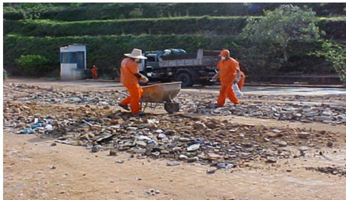
FIGURA 7 - Processo de separação manual dos resíduos.