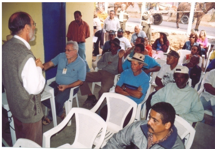
FIGURA 14 - Curso de capacitação para carroceiros