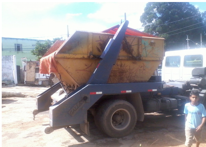
FIGURA 3 – Caminhão de recolhimento de caçambas

Os geradores de resíduos são responsáveis pela destinação adequada dos mesmos e por isso exige atenção na contratação do serviço de transporte. Este transporte deve ser feito por caminhões com equipamentos de recolhimento, com cobertura ou proteção para evitar possíveis derramamentos de resíduos em vias públicas. Para os resíduos de classe A, podem ser usados caminhões com caçambas (Fig. 3), para classe B e C podem ser usados caminhões comuns e para classe D é necessário transporte específico, conforme resolução Conama 307/02 e deve ser feito por empresas transportadoras licenciadas.