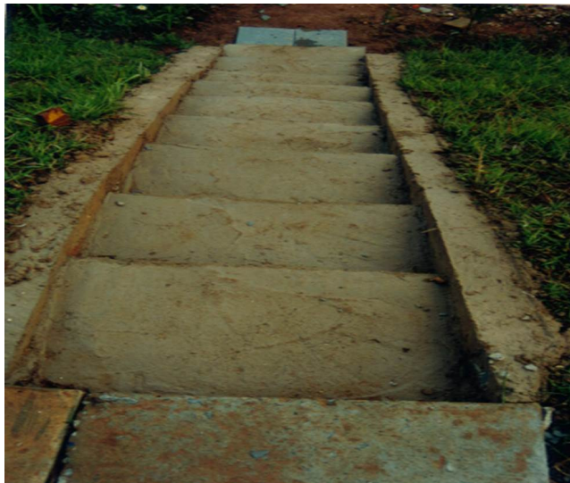
FIGURA 9 - Utilização de agregado reciclado - Escada ERE Pampulha