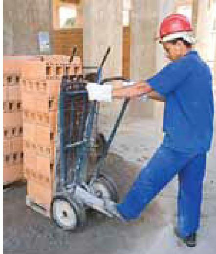
FIGURA 2 – Gestão correta nos canteiros de obra - Transporte adequado de blocos cerâmicos