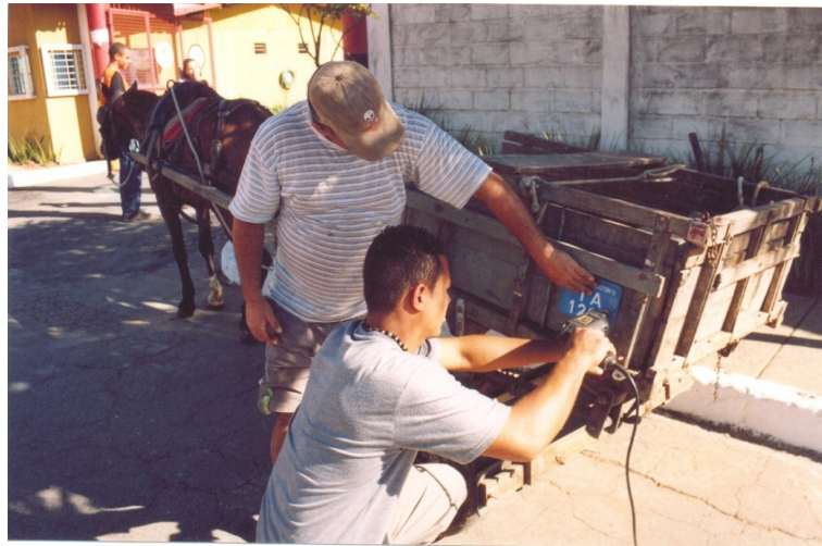
FIGURA 15- Emplacamento das carroças