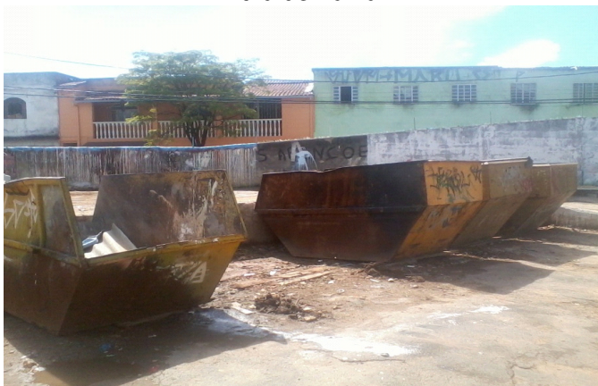
FIGURA 5 - Local de transbordo, triagem e acomodação das caçambas da URPV Átila de Paiva.