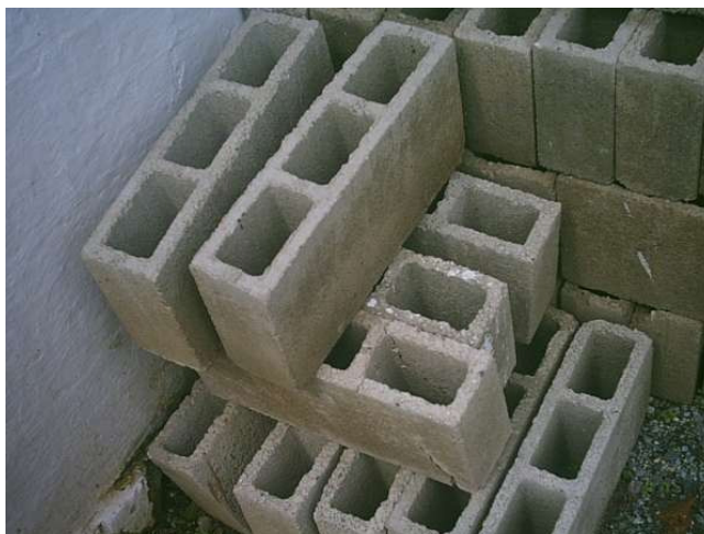
FIGURA 13 – Ecobloco