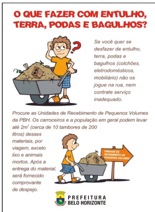
FIGURA 17 - Impresso informativo

neutralizar resistências e buscar o envolvimento da comunidade para garantir o funcionamento das unidades em harmonia com a vizinhança e a apropriação das mesmas pela comunidade.