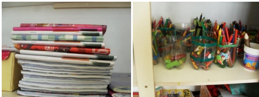
Figuras 1 e 2 – Fotos de Gabriel

Pesquisador: – Gabriel, das coisas que você tirou foto do que você faz aqui na UMEI, quais são as coisas de que você mais gosta?