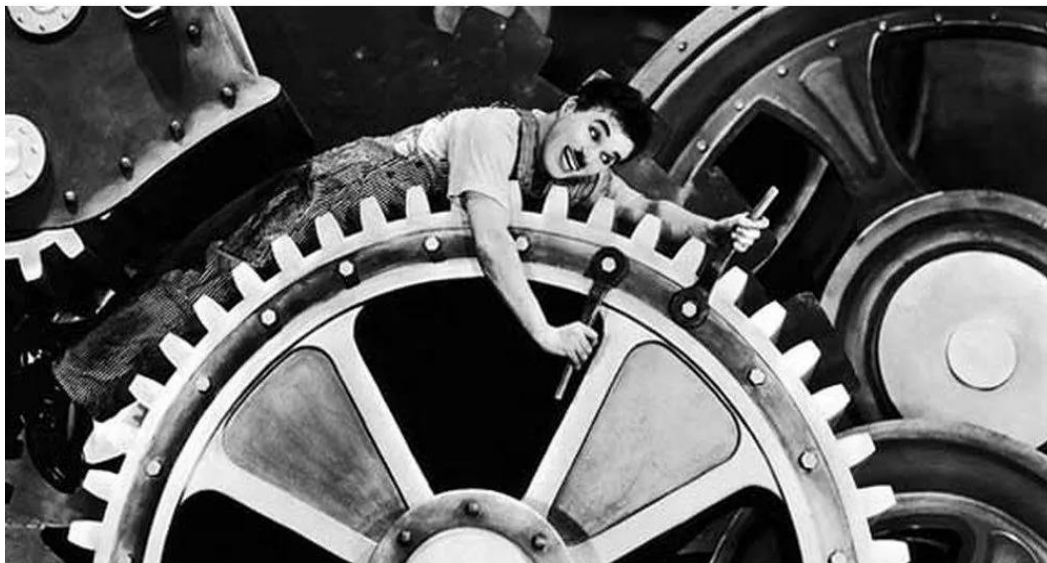
Figura 2: Charles Chaplin e a Mecanização nas Relações de Trabalho