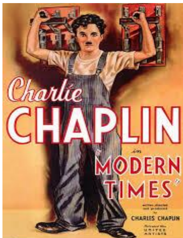
Figura 1: Filme Tempos Modernos