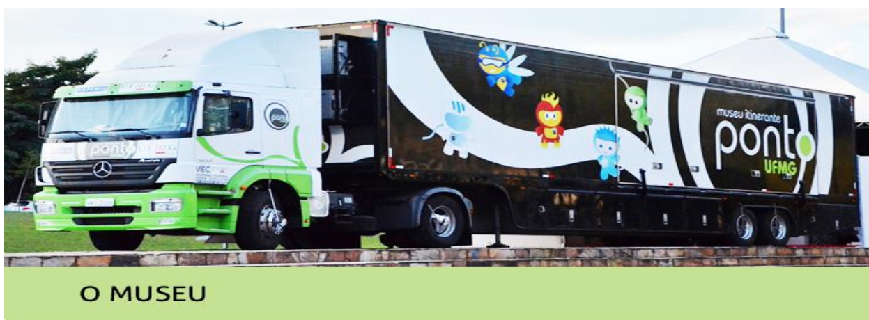
Figura 3: Museu Itinerante ponto UFMG

1º) o professor fará um breve comentário sobre o assunto da aula anterior e em seguida, organizará a turma para assistir ao filme “Tempos Modernos”. Por se tratar de um documentário que mostra a rotina e a repetição das mesmas atividades na vida dos trabalhadores numa linha de produção.