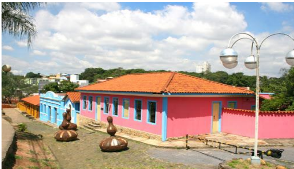
Figura 5 – Casa de Cultura de Contagem