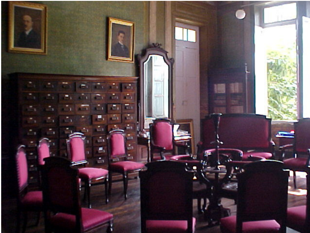
Foto do atual Salão Nobre do Grupo Escolar Paula Rocha, com o mobiliário referente ao início do século XX.

Manusear essas fontes certamente possibilitou-nos uma aproximação da cultura escolar que se instituiu em Minas Gerais, no início do século passado, e em especial, neste grupo escolar mineiro. Porém, embora a escola guarde, ainda hoje, uma significativa documentação, foi um espaço de difícil acesso, pelas condições em que se encontravam as fontes.