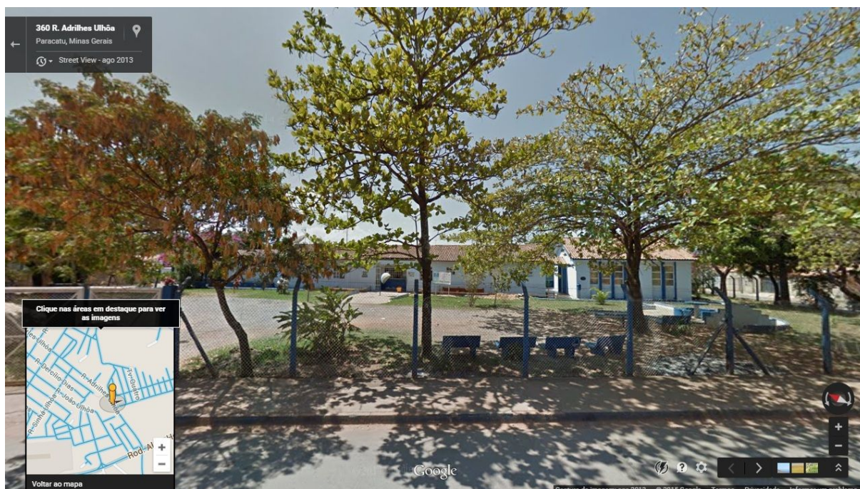
Imagem 4 - Sede do CSF Chapadinha