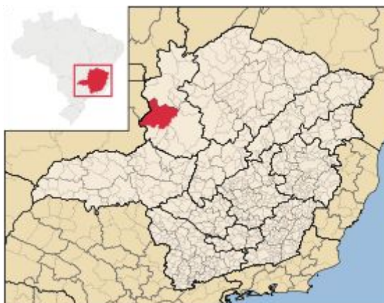
Imagem 1 - Localização geográfica, Paracatu (MG)

Paracatu é uma cidade com população estimada de 84.718 (BRASIL, 2010) com crescimento populacional impulsionado pelo êxodo rural das últimas duas décadas e, também, por migração de populações das regiões vizinhas.