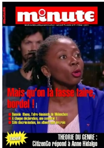
Figura 1 – Jornal Minute , outubro 2017