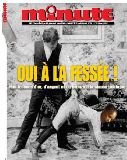
Figura 6 – Jornal Minute , novembro 2014