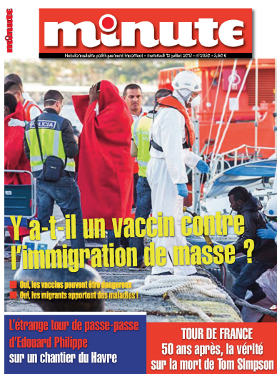
Figura 2 – Jornal Minute , julho 2017 Figura 3 – Jornal Minute , novembro 2017

Voltemos à observação de mais algumas primeiras páginas de Minute , o jornal politicamente incorreto.