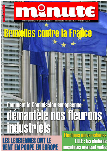
Figura 4 – Jornal Minute , novembro 2017 Figura 5 – Jornal Minute , julho 2013

No mapeamento dos temas e figuras, observados como componentes da semântica discursiva na teoria semiótica, e que reproduzem nos textos o imaginário social, encontramos, na análise das primeiras páginas de Minute , outro tema que pode estar associado à questão da doença física e mental discutida anteriormente. Trata-se da questão da homossexualidade, como se pode observar nas primeiras páginas a seguir.