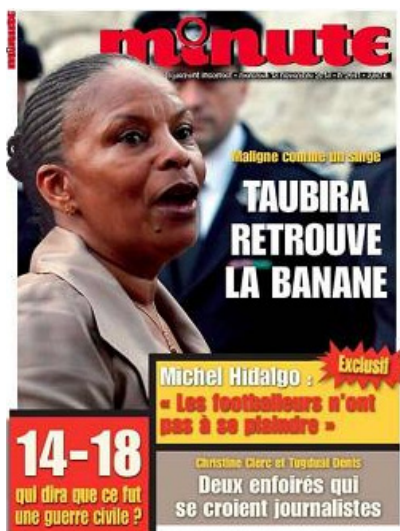
Figura 6 – Jornal Minute , novembro 2014