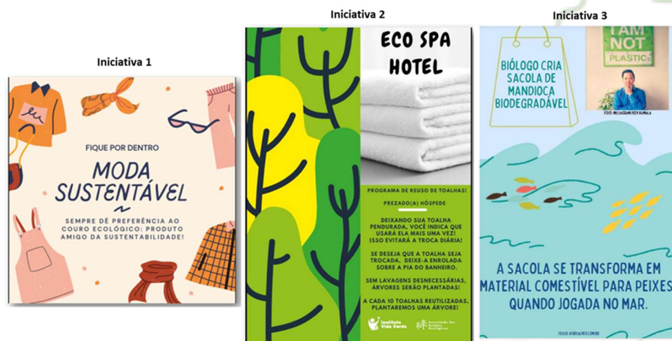
Figura 2: Textos das iniciativas analisadas pelos alunos na atividade da aula selecionada