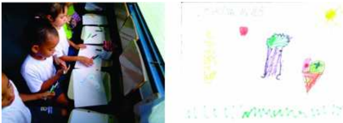
FIGURA 8 – Momento em que as crianças escrevem e desenham