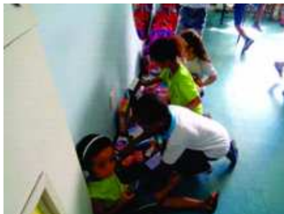
FIGURA 11 – Organização de uma loja com as embalagens