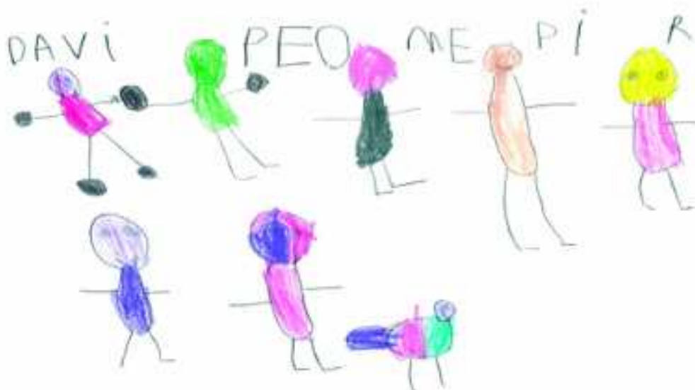
FIGURA 5 – A escrita dos nomes dos familiares da criança Davi: PEDRO, MÃE, PAI e RITA