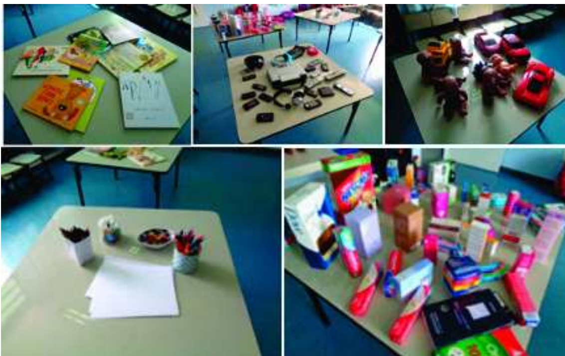
FIGURA 7 - Cantinhos com atividades diversificadas