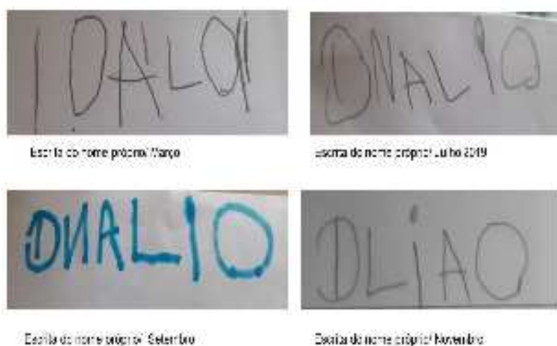
FIGURA 6 – Evolução da escrita do nome próprio da criança DANILO