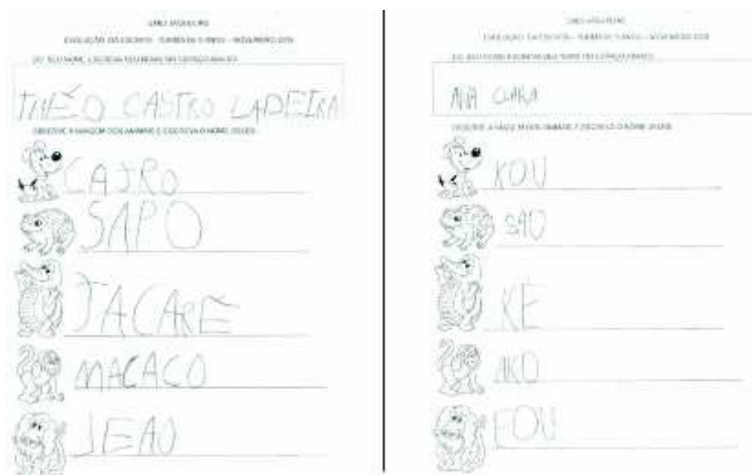
FIGURA 4 – Hipótese de escrita de duas crianças realizadas no mês de novembro. Théo que estuda na EMEI Jaqueline desde os 3 anos e Ana Clara que iniciou na primeira turma do berçário em 2014