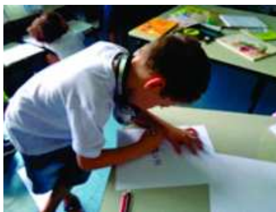
FIGURA 10 - Momento em que a criança responde que está escrevendo igual a um professor