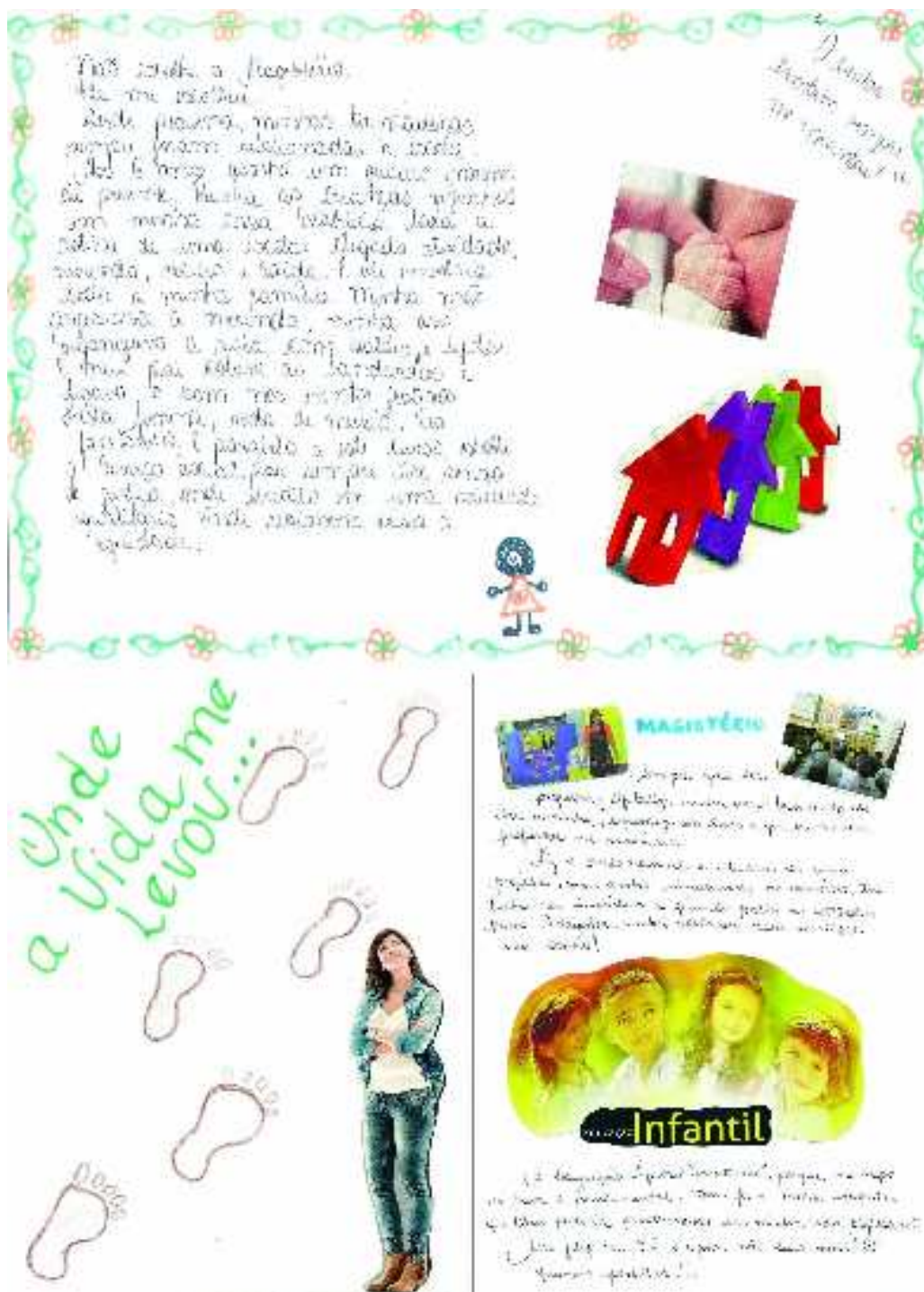
FIGURA 1 – Relato das professoras sobre a escolha do magistério e educação infantil