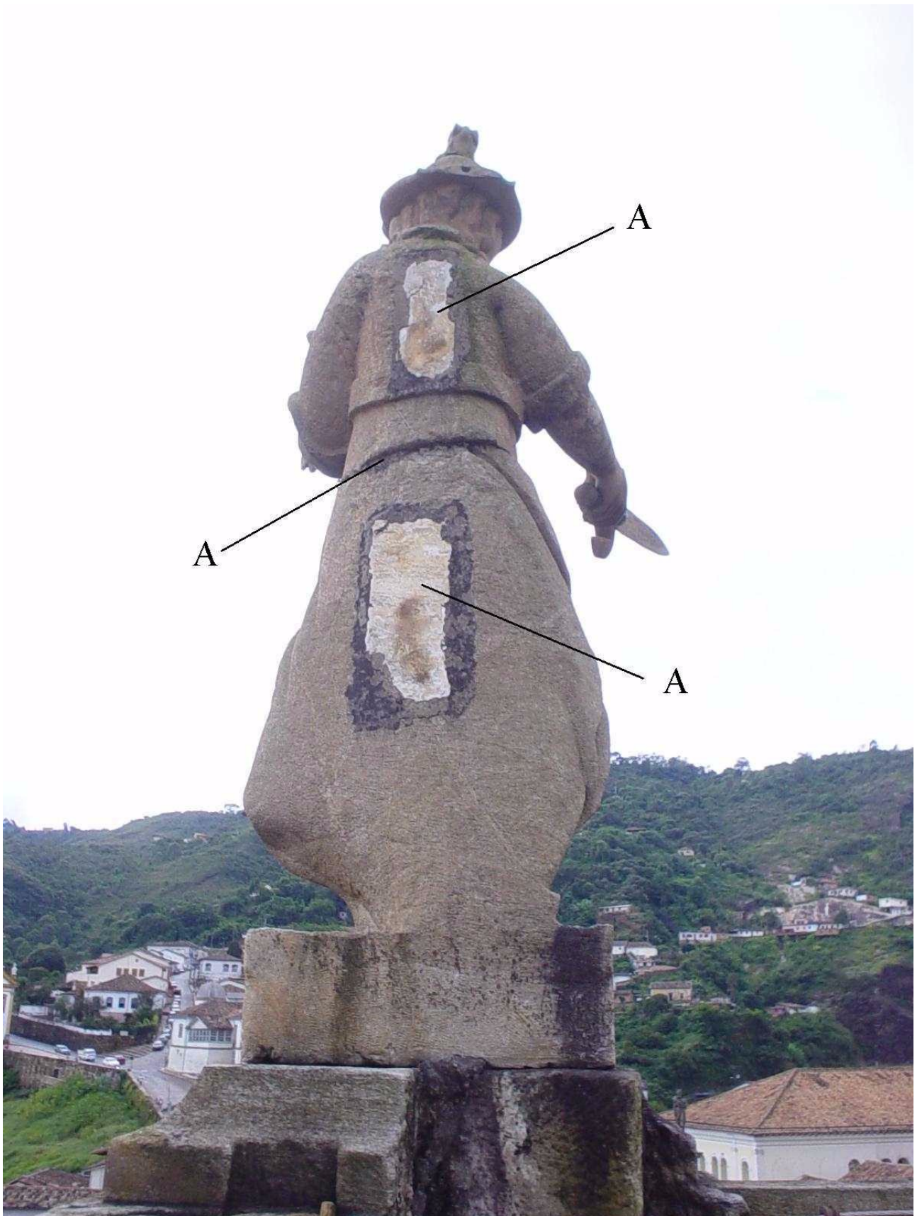
Figura V.2: Feições de alteração na estátua Justiça (A – complementação com argamassa)