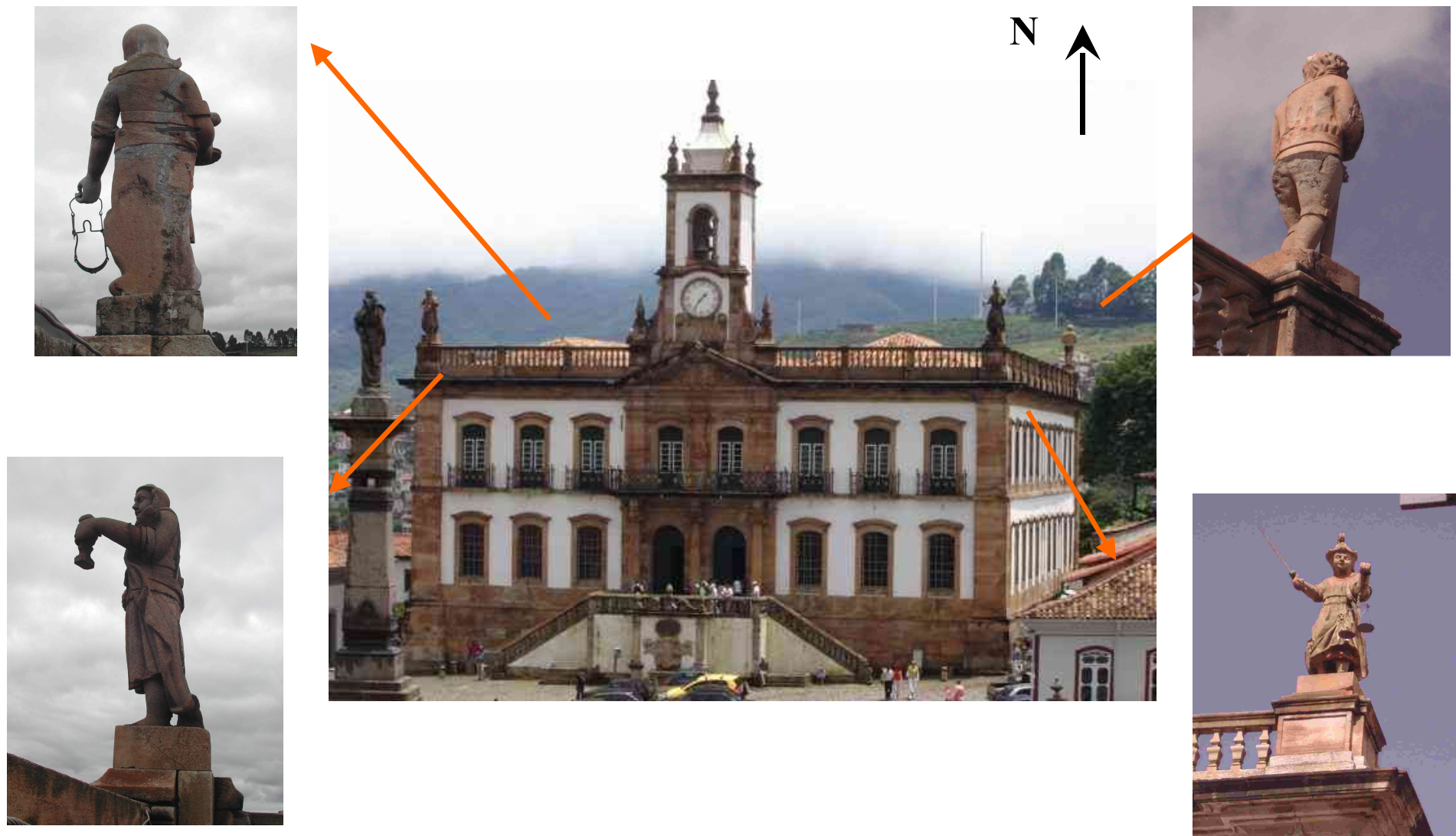
Figura V.1: Vista geral das quatro estátuas: Justiça (SE); Prudência (NW), Temperança (SW), Fortaleza (NE), Museu da Inconfidência Mineira, OP.