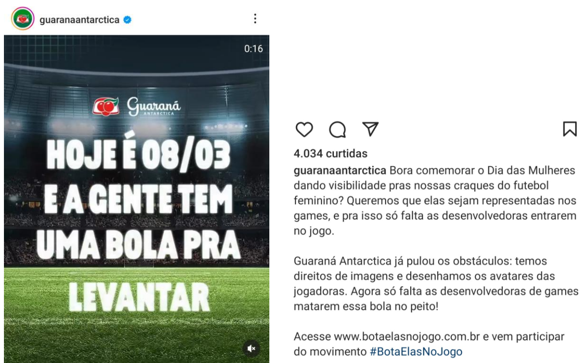
Imagem 7 – Divulgação do Guaraná Antarctica na rede social Instagram com a expressão idiomática “bola para levantar” (equivalente a “levantar a bola”)

Fonte: GUARANÁ ANTARCTICA, 8 mar. 2023. 17