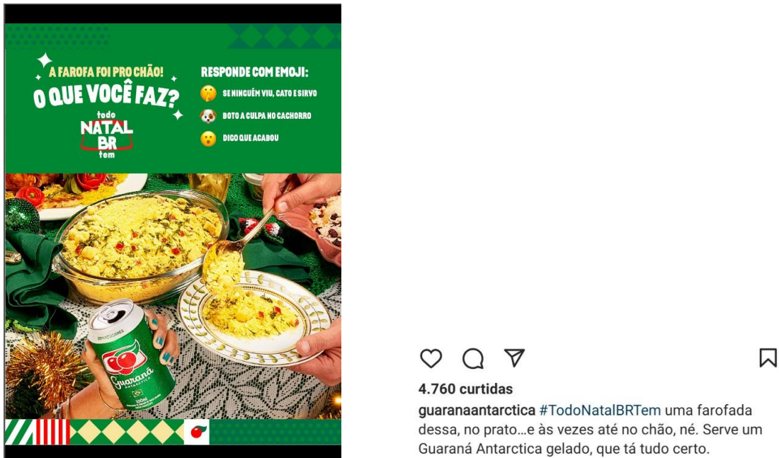
Imagem 6 – Divulgações do Guaraná Antarctica na rede social Instagram com a tag “Todo Natal BR tem”

16