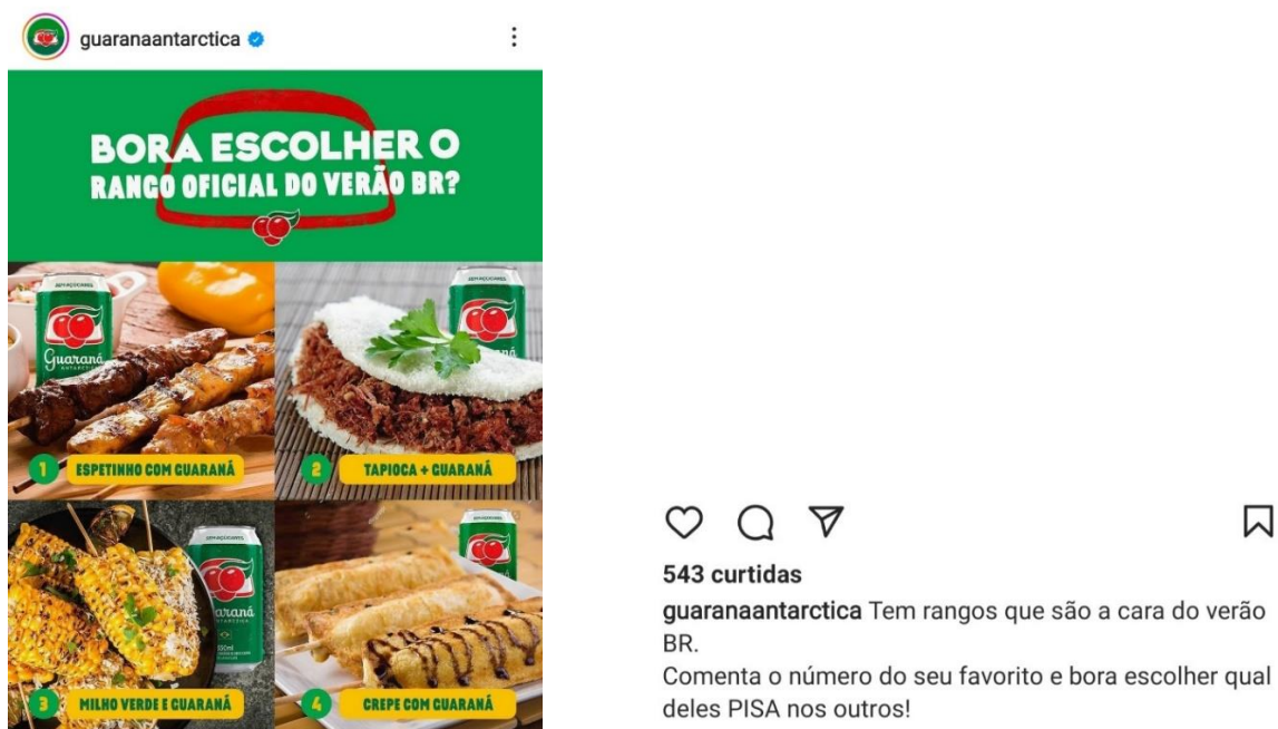
Imagem 11 – Divulgação do Guaraná Antarctica no Instagram: criativo com uso de “bora”

Fonte: GUARANÁ ANTARCTICA, 7 jan. 2023. 21