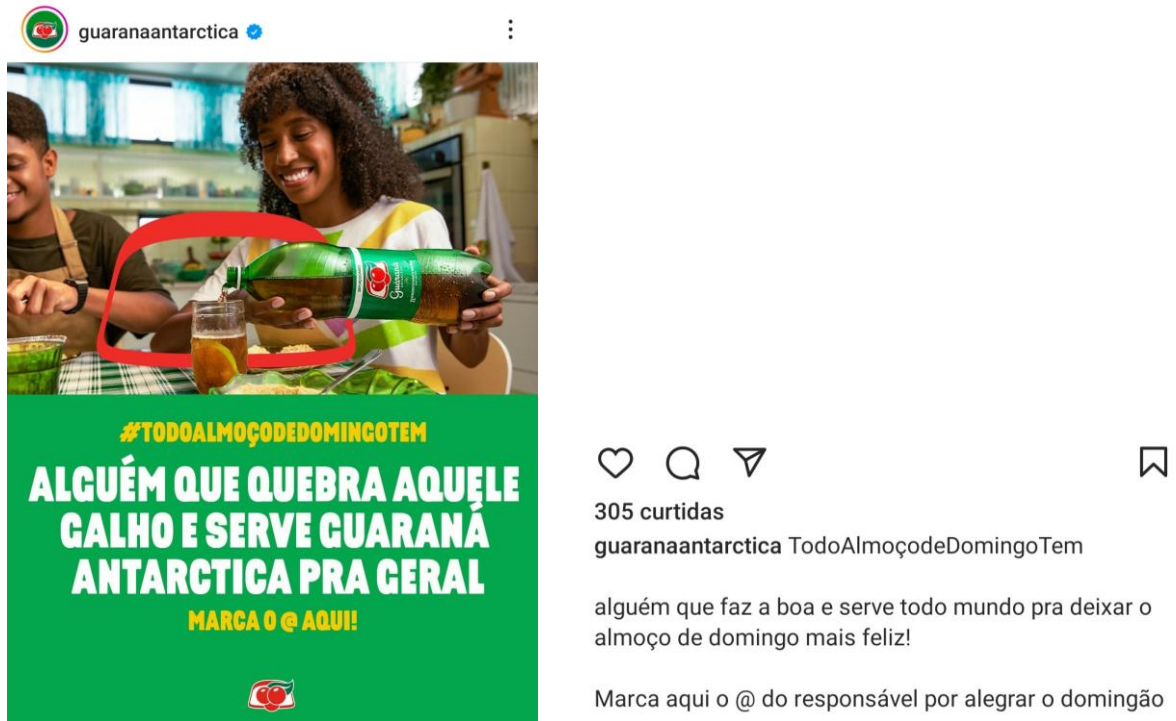
Imagem 8 – Divulgação do Guaraná Antarctica na rede social Instagram com a expressão idiomática “quebra aquele galho” (equivalente a “quebrar um galho”)

18