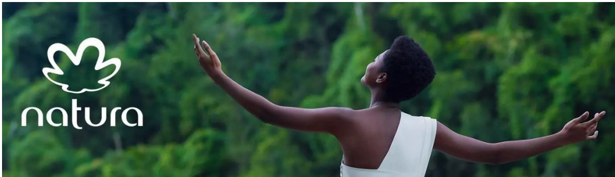
Imagem 12 – Divulgação da história da marca Natura, feita no site da empresa