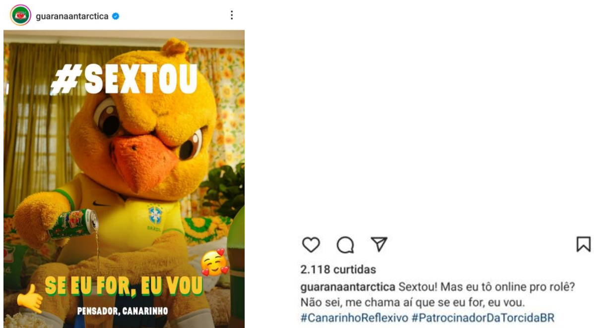
Imagem 10 – Divulgação do Guaraná Antarctica no Instagram: criativo com uso de “sextou”

Fonte: GUARANÁ ANTARCTICA, 4 nov. 2022. 20