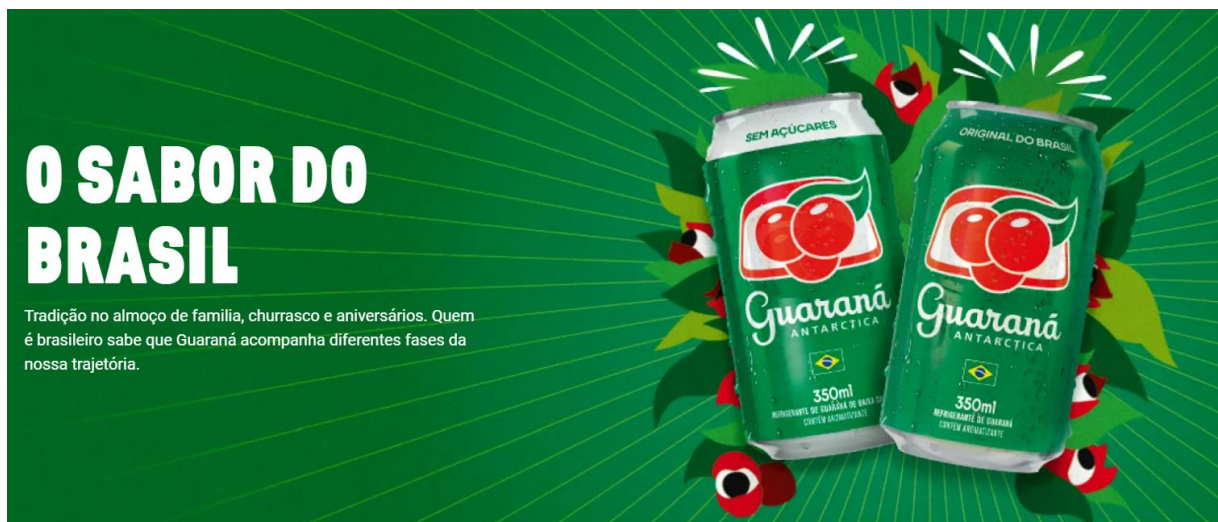
Imagem 2 – Propaganda do Guaraná Antartica