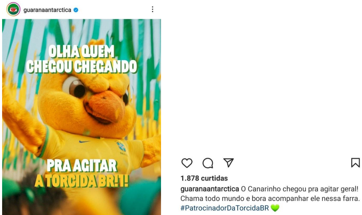
Imagem 9 – Divulgação do Guaraná Antarctica na rede social Instagram com a expressão idiomática “chegou chegando”

19