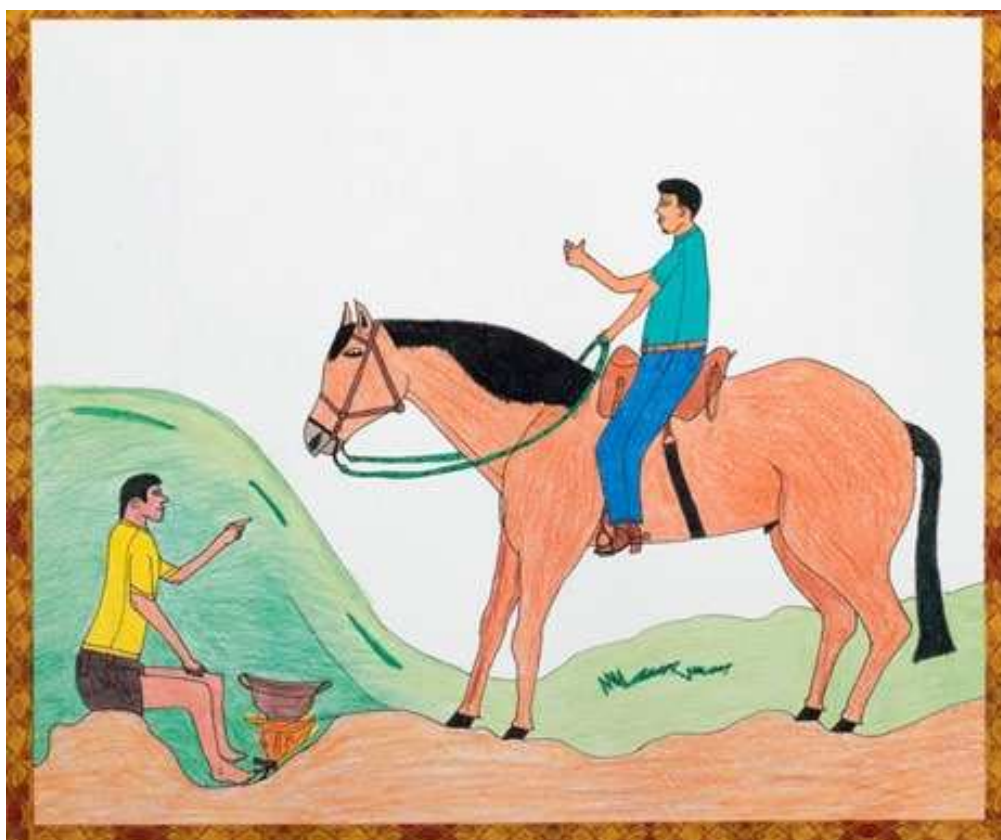
Figura 4: Reprodução de lâmina do livro Voltando do passado para o presente.