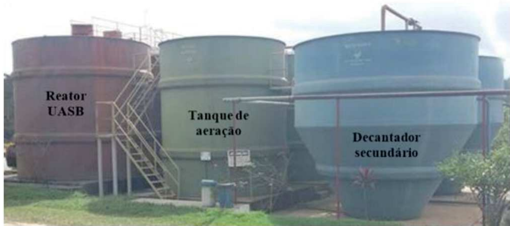
Figura 1 - Foto da disposição das unidades da ETE

Pelo projeto da ETE, nos decantadores secundários, o lodo aeróbio sedimentado e adensado retorna para os tanques de aeração (linha de recirculação). Esse retorno é efetuado através de um sistema denominado “ air lift ”, que utiliza o mesmo ar de processo gerado pelo soprador. O lodo de excesso é também retirado dos decantadores e encaminhado/descartado para a elevatória de bombeamento do esgoto (após o tratamento preliminar), de forma a se estabilizar no interior dos próprios reatores UASB. A Figura 2 apresenta o layout da ETE.