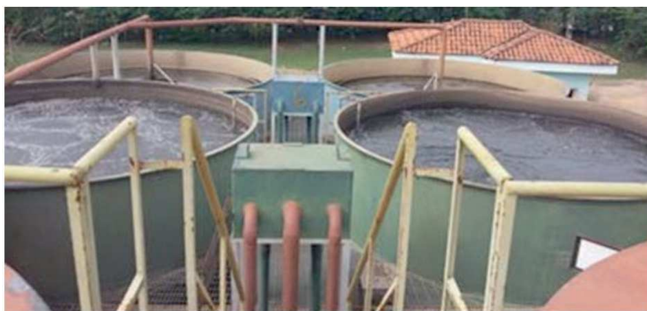
Figura 3 – Vista do tanque aerado e do decantador secundário

A Figura 3 mostra a vista de cima do tanque de aeração, do decantador secundário e das caixas de distribuição. Pela Figura, percebe-se a grande área superficial em turbulência que foi considerada como principal unidade problemática da ETE.