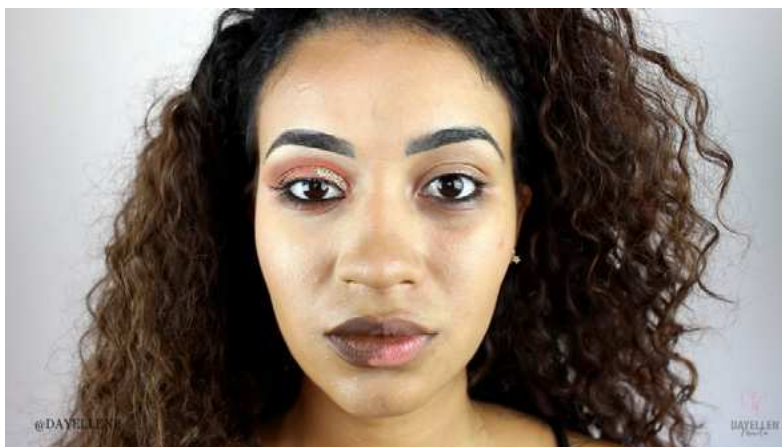
Figura 11 – Vlogueira revela rosto metade maquiado, metade limpo

Fonte: https://www.youtube.com/watch?v=JfLER23KOSs . Acesso em: 26 dez. 2022.