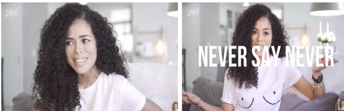
Figuras 14 e 15 – Recursos da linguagem verbal e corporal usados pela vlogueira