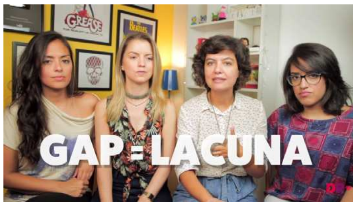
Figura 9 – Adição de nota explicativa no vlog