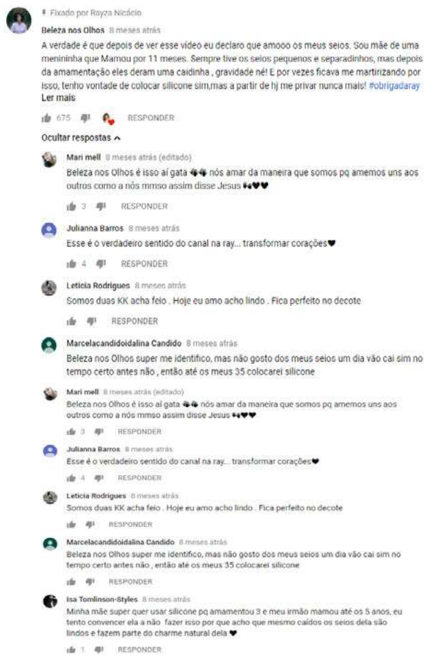
Figura 16 – Registro das interações entre as enunciatárias do vlog 3