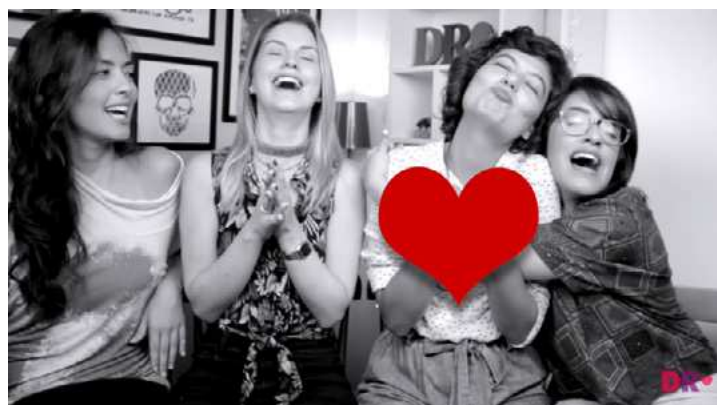
Figura 8 – Cena do vlog que revela um erro de gravação e foi inserido no vídeo nas cores preta e branca