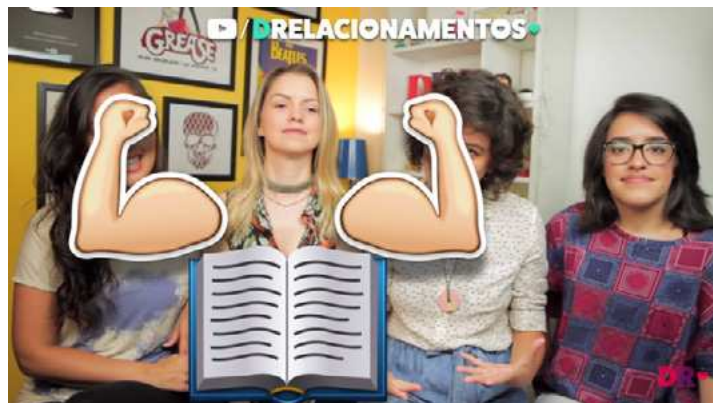
Figura 3 – Utilização de emojis para ilustrar a fala das vlogueiras