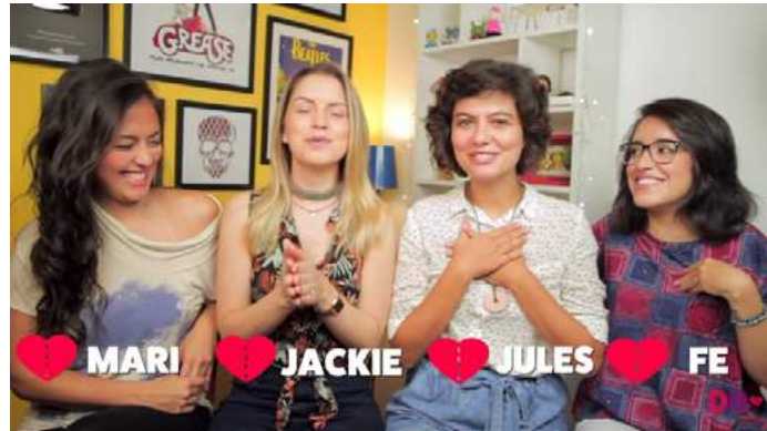
Figura 2 – Apresentação das vlogueiras

Fonte: https://youtu.be/LGtTxmc5_s4 . Acesso em: 26 dez. 2022.