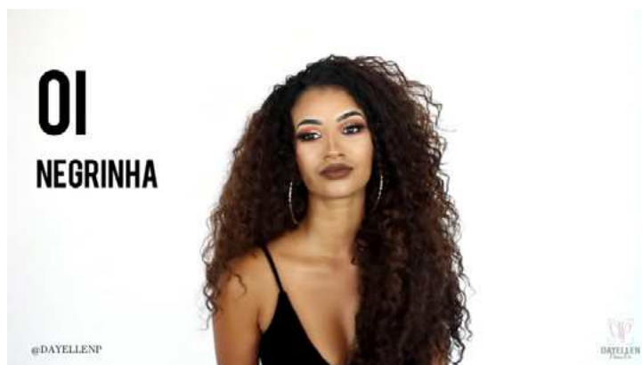
Figura 10 – Imagem do início do vlog com o cumprimento da vlogueira