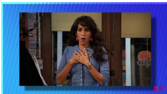
Figura 6 – Utilização de imagem cômica da série Friends