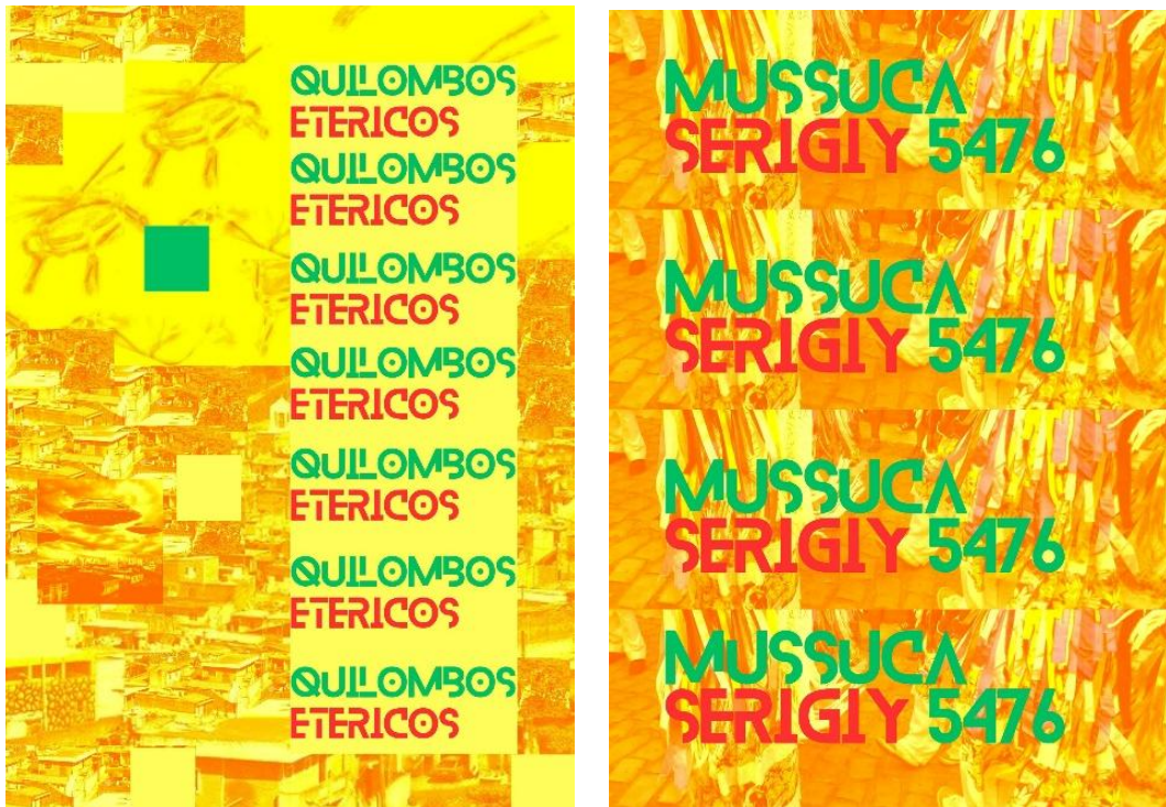
Figura 02 – zine Motores Sagrados.

criou um contraste vibrante e lúdico para o elemento tipográfico.