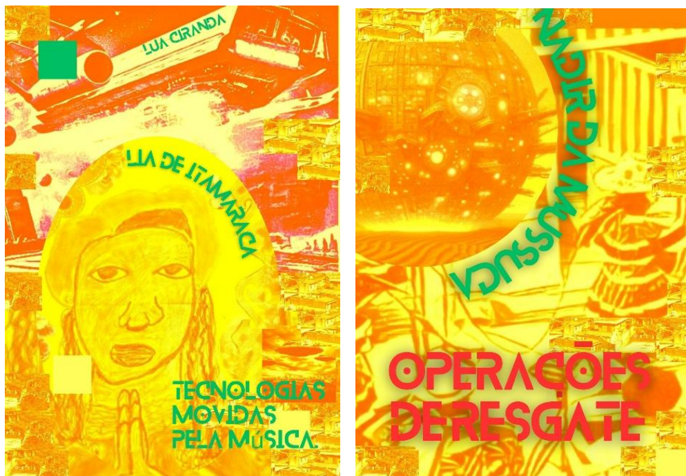
Figura 03 – Zine Motores Sagrados.

Ao experimentar justapor índices afro-diaspóricos com índices afro-futuristas a poética de construção do zine permitiu o exercício de inscrição da racialidade como elemento futurista a ser pensada pelo elemento pedagógico no ensino-aprendizagem em artes. Ao acionar a metodologia de Escrita de |Vida através dos Atos Autobiográficos a abordagem zinopoética permitiu a imersão na poética de artistas locais, o que aponta para a capacidade dos zines de dialogar com realidades de forma capilarizada e assim gerar possibilidade de processos pedagógicos singularizados.