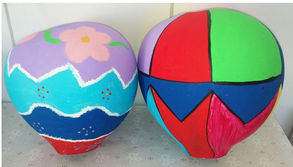
Figura 25: Representação do balão vermelho com cabaça