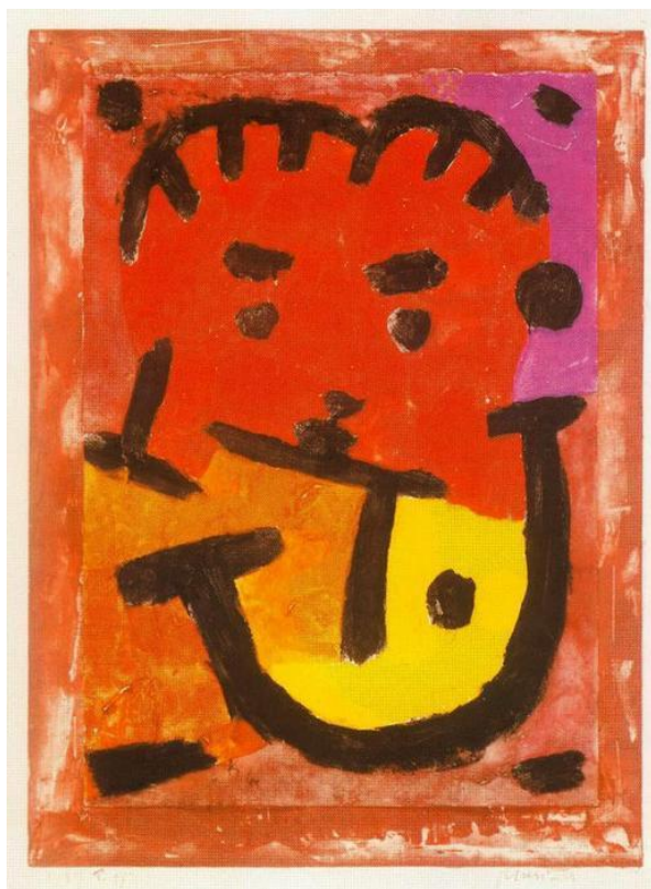
Figura 14: Obra Música (1937)