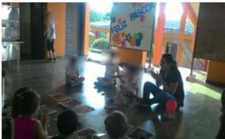
Figura2: Contação da história