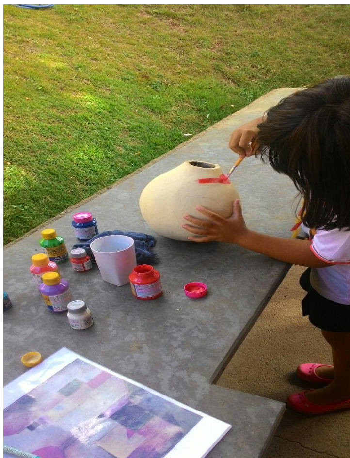
Figura 24: Pintura na cabaça