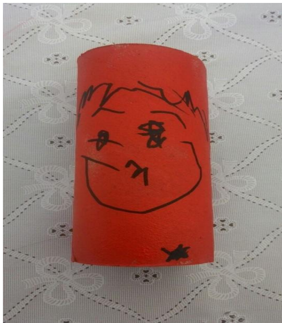
Figura 17: Releitura da obra Músico (1937)