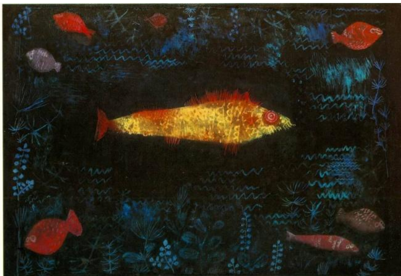
Figura 3: Obra O Peixe Dourado (1925)