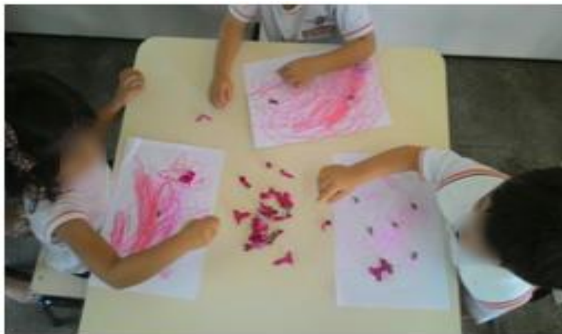
Figura 12: Produzindo trabalho