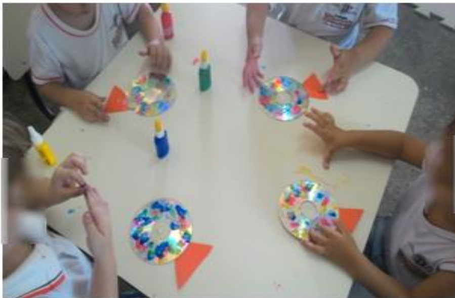
Figura 6: Montando os peixes