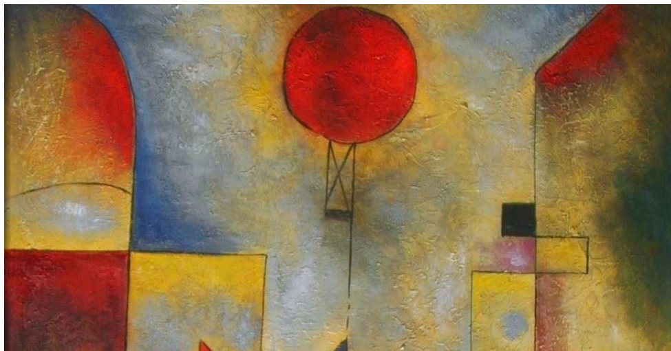
Figura 23:Obra Balão Vermelho (1922)