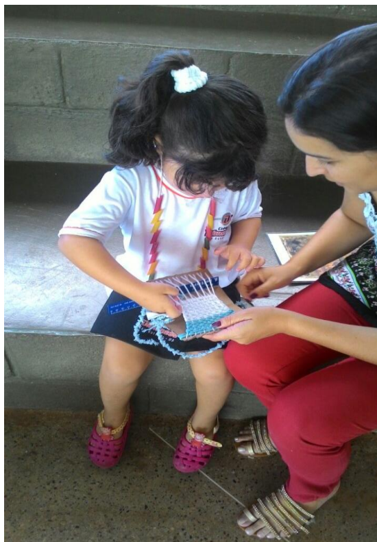
Figura 20: Tecelagem no papelão