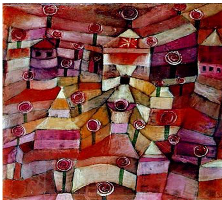
Figura 11: Obra Jardim de Rosas (1920)