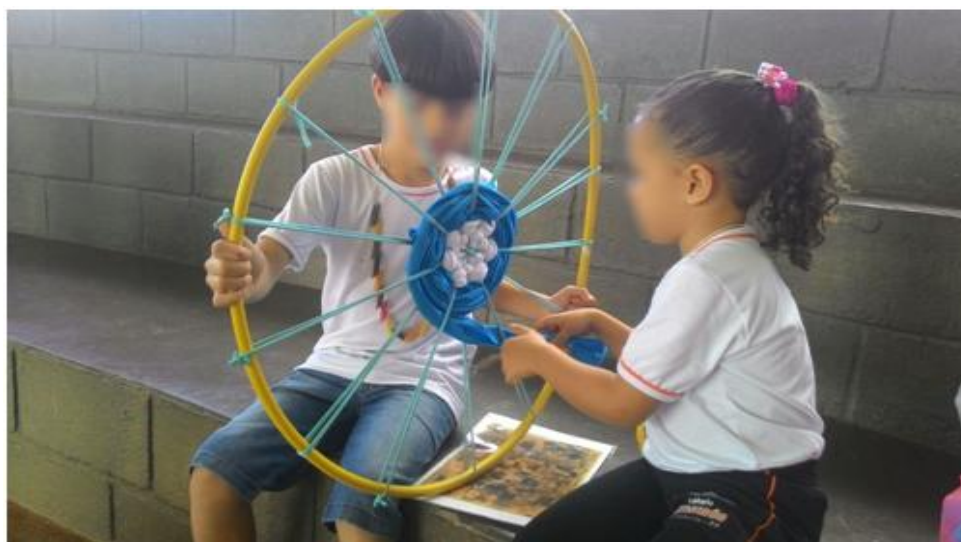
Figura 22: Tecelagem no bambolê

Brincando com tintas, cores, pincéis, rolos, água e manipulando outros materiais é possível a exploração não apenas o mundo material, mas também da cultura à sua volta, aprimorando a interação, comunicação através das sensações, fantasias, sonhos e ideias. Principalmente na oficina de tecelagem, no momento em que os tapetinhos ficaram prontos, as crianças simbolizaram personagens com sucatas e os colocavam em cima desses tapetinhos fazendo-os voar, como conta na história.