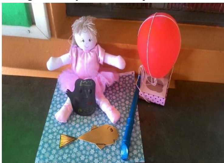
Figura1 : Objetos da contação da história

Logo após ouvirem a história, as crianças foram encaminhadas à sala de aula onde puderam proceder com uma leitura formal das obras, manuseando-as e observando as linhas, cores, luz, traços, sombras, formas, momento em que na apreciação da obra puderam investigar através da aproximação, a composição das obras de Paul Klee através de uma leitura aproximada, para procederem com a releitura.