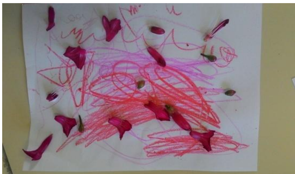
Figura 13: Resultado