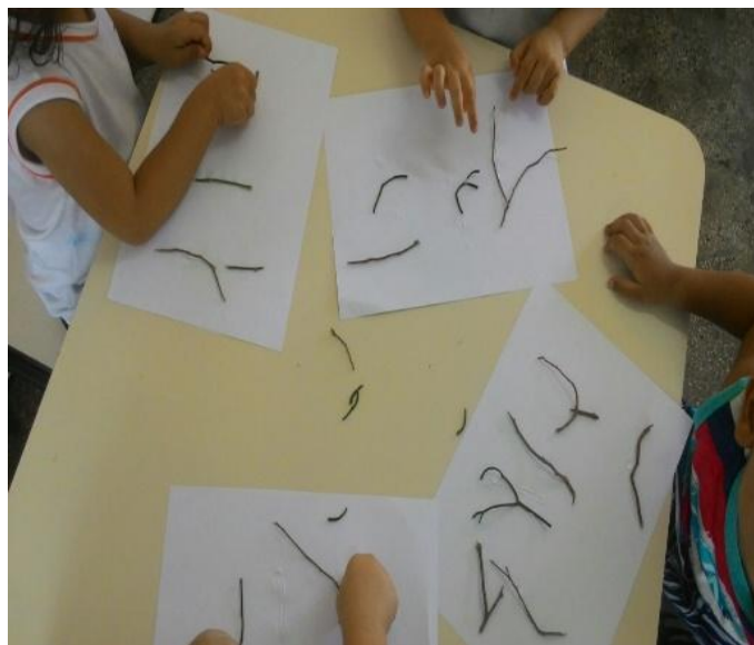
Figura 9: Produzindo o trabalho