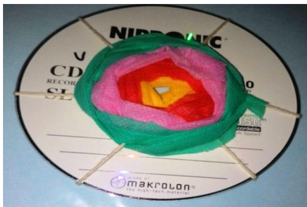
Figura 21: Tecelagem no CD