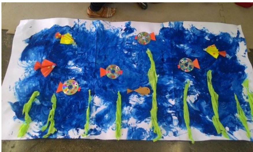
Figura 7:Releitura da obra