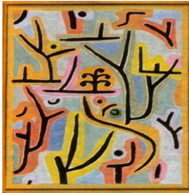
Figura 8: Obra Parque perto de Lu (1938)