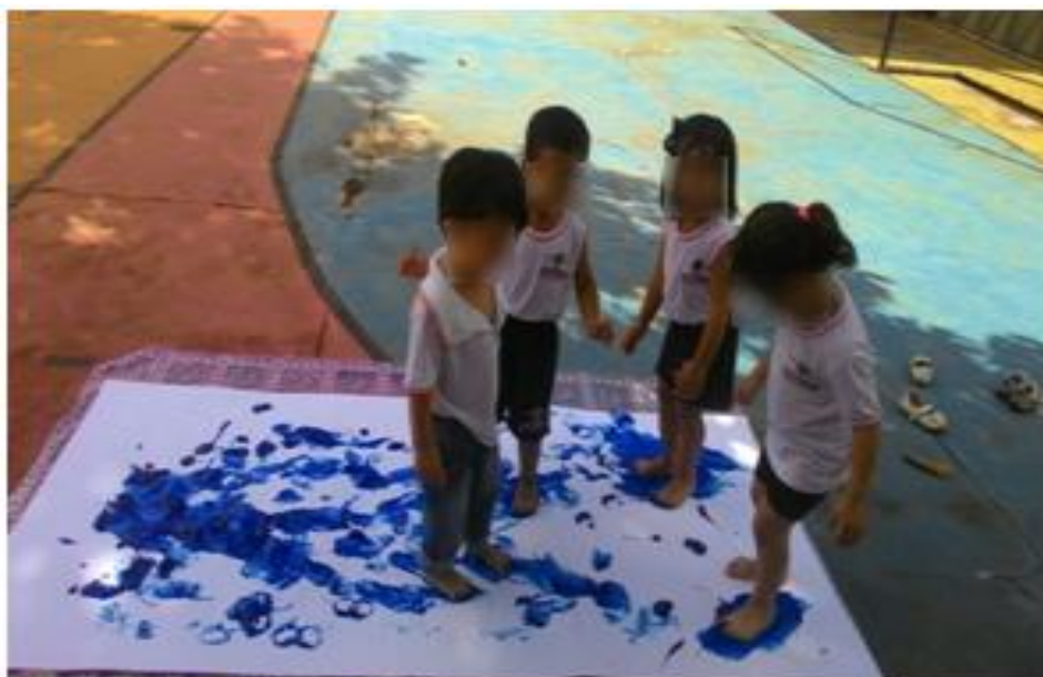
Figura 4 : Crianças pintando com pés