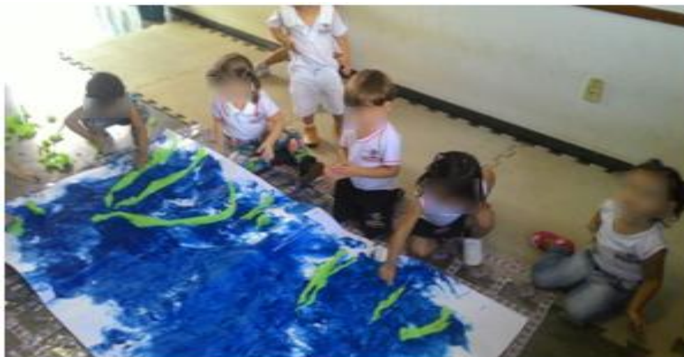
Figura 5: Manipulando os materiais na criação

Outro aspecto importante é a exploração dos materiais que proporcionam prazer e faz parte do processo de produção e da descoberta; rasgar, colar, amassar, furar, moldar, contribui para expressão artística da criança.