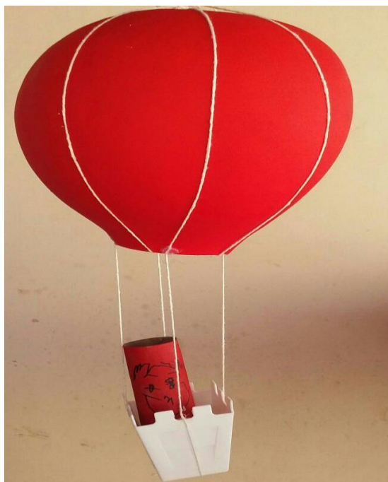
Figura 18: Representação do músico no balão