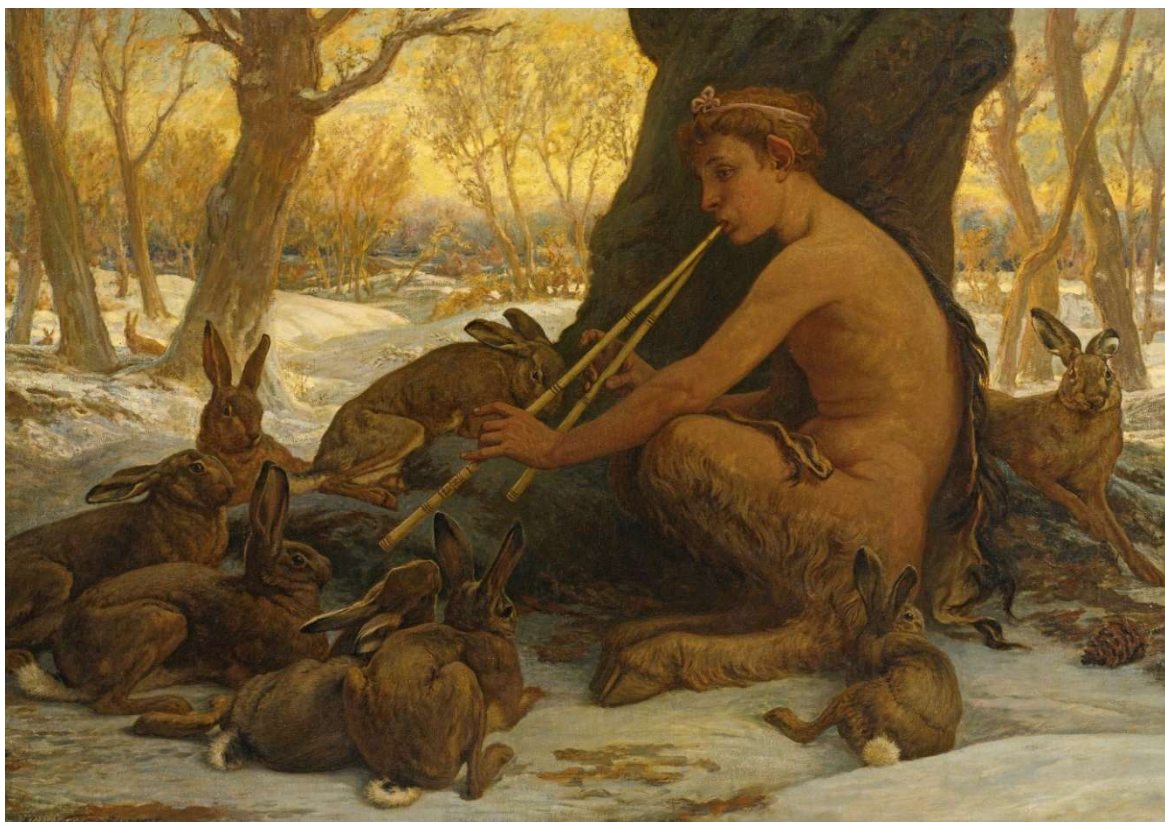
Figura 1: Elihu Vedder (1836 - 1923) — O jovem Marsias encantando as lebres (1878), óleo sobre tela.

Fonte: Crystal Bridges Museum of American Art ( Wikimedia.org )