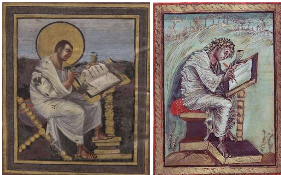
Figura 2: Representações de São Mateus nos Evangelhos da coroação de Viena (esquerda) e no Evangelário de Ebo (direita).

Fonte: ESQUERDA — Evangelhos da Coroação de Viena , c. 800-810 (Viena, Kunsthistorisches Museum, Schatzkammer, Inv. XIII 18). DIREITA — Evangelário de Ebo de Reims , c. 816-35 (Bibliothèque Municipale, Épernay).