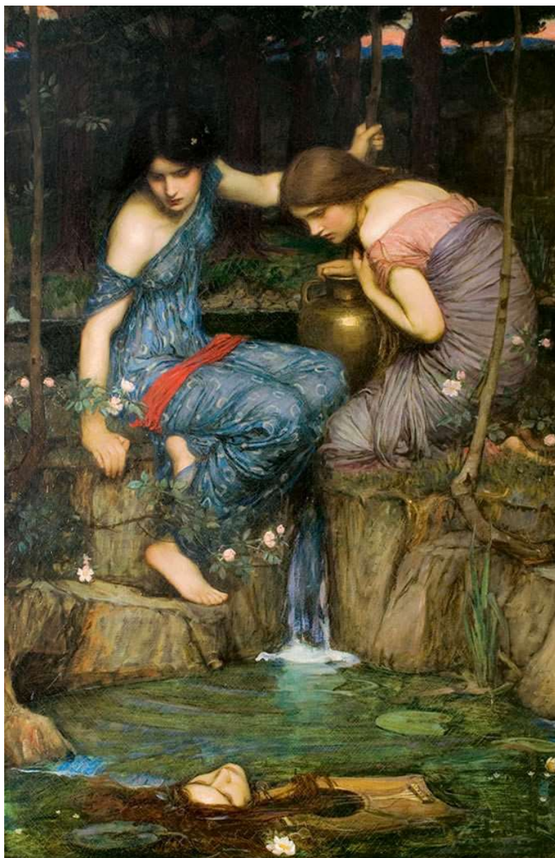
Figura 3: John William Waterhouse (1849 – 1917) — Ninfas encontrando a cabeça de Orfeu (1900), óleo sobre tela.