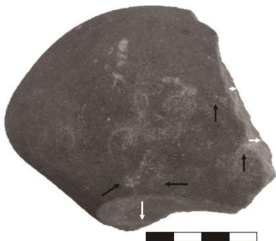
Figura 1. Marcas de percussões insistentes em um mesmo setor, características de aprendizes. Exemplo de seixo debitado do sítio de Buritizeiro (Minas Gerais), com destaque (setas pretas) para algumas percussões errôneas, feitas nas proximidades do local desejado, porém fora dele, mais para o interior do plano de percussão e que indicam ainda uma falta de controle do gesto. As setas em branco indicam as percussões bem-sucedidas.

espessas, além de instrumentos bifaciais (delgados ou espessos) e de instrumentos simples (Rodet et al. , no prelo ). Deve-se destacar a qualidade da matéria-prima utilizada: um quartzito silicificado de granulometria fina, muito homogêneo. No Corte IV alguns dos instrumentos se destacam: apresentam as normas sociais do grupo (dimensões, suporte, morfologias, técnicas), entretanto são realizados sobre uma matéria-prima de qualidade inferior (quartzito de granulometria mais grossa, menor grau de silicificação), e apresentam erros de lascamento (acidentes refletidos marcantes resultantes da insistência em golpear os locais que apresentam refletidos, levando ao esgotamento da exploração do setor – figura 2). Devido a essas características, tais instrumentos são interpretados como sendo, muito provavelmente, produto de lascadores aprendizes (Rodet et al. , no prelo ).