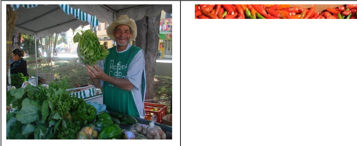
Figuras 01 e 02 - Produtos comercializados na Feira Raízes do Campo - 2016