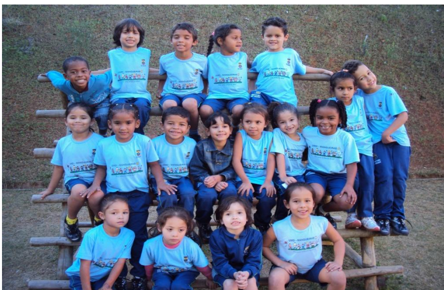
Fig. 02 Alguns alunos da turma em 2012