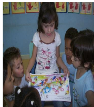
Fig. 04 Aluna contando história