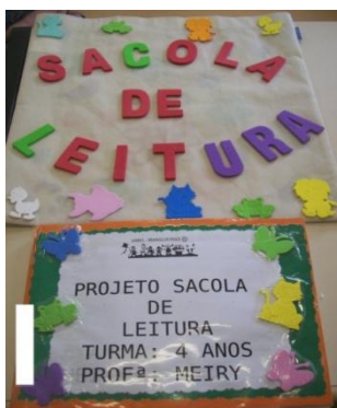
Fig. 03 Sacola de leitura