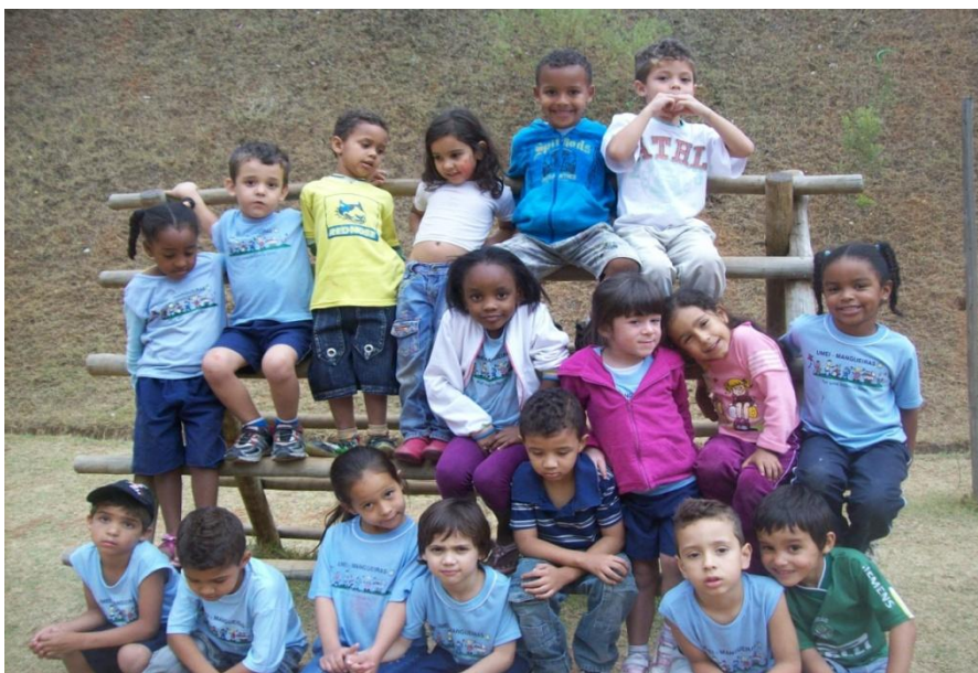
Fig. 01 Alguns alunos da turma 2011

A turma apresenta características compatíveis com a faixa etária, com exceção das duas crianças portadoras de necessidades especiais, que necessitam de serem mais estimuladas conforme suas próprias características.