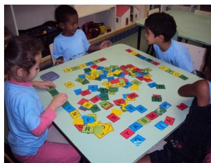
Fig. 08 Escrita do nome com alfabeto móvel

No primeiro semestre de dois mil e doze, iniciamos em fevereiro atividades que permitiram a livre expressão do aluno através de: Atividade de leitura que envolveram além da escrita, imagens e sinais, listas de palavras, caça letras e caça palavras, atividades relacionadas ao reconhecimento de todas as letras do alfabeto, escrita espontâneas, alfabeto móvel, produções de textos a partir de outros conhecidos, jogos de letras e de bingo, trabalho com rótulos.