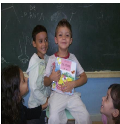
Fig. 05 aluno contando história