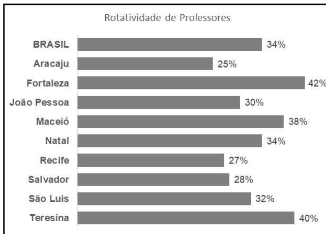
GRÁFICO 1 - Rotatividade de Professores (Prova Brasil 2017).

FONTE: Questionário do diretor da Prova Brasil, 2017.