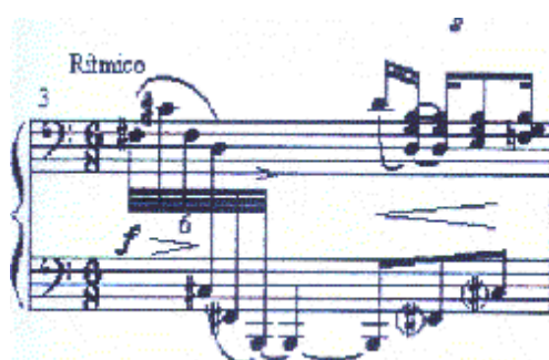
exemplo 31b, comp. 3.

Também foi observado, durante o estudo deste Poesilúdio ao piano, que as passagens onde os materiais são derivados do arabesco, exemplo nº 31 a, são melodiosas e as passagens cujos materiais têm origem na figuração pianística e nas síncopes, do exemplo nº 31b, possuem um caráter rítmico mais acentuado e, de fato, Almeida Prado diz que a passagem Rítmico (comp. 3 a 7) ilustra o sapateado da dança flamenga (informação pessoal). Então, conclui-