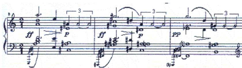
Exemplo nº 30, comp. 6 – 8.

Na terceira parte permanece a movimentação da primeira voz através do ritmo pontuado e das quiálteras, porém contrasta com a segunda parte por causa das appoggiaturas e da dinâmica ff que decresce para p . Exemplo nº 30: