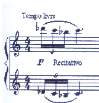
Exemplo nº 31a, comp.1