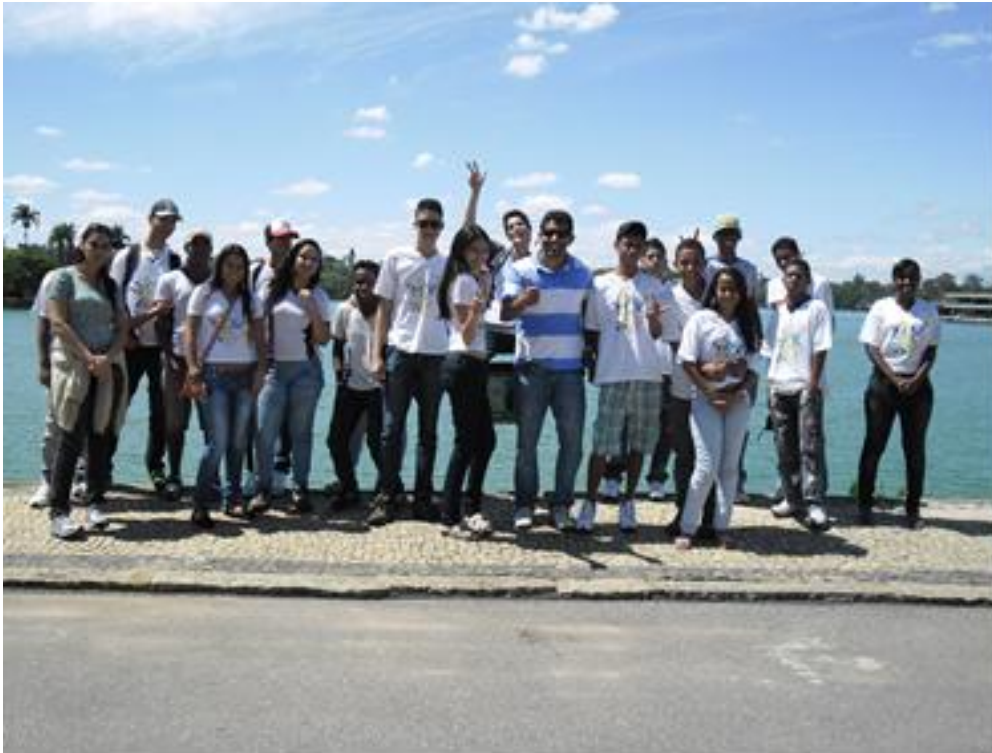
FIGURA 1: Trabalho de campo BH: É aqui que eu moro! Lagoa da Pampulha