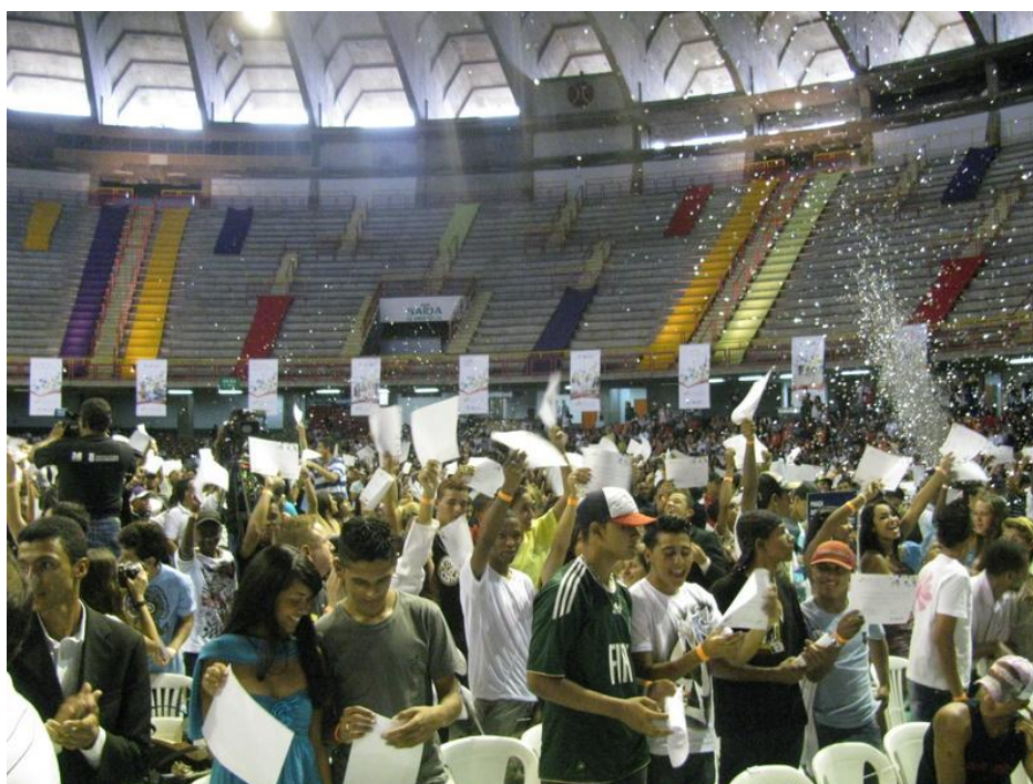
Figura 4: Formatura do Programa Floração 2011 – Mineirinho

O ápice do resgate da autoestima dos alunos foi a celebração de uma vitória importante em suas vidas: a formatura do ensino fundamental (Figura 4).