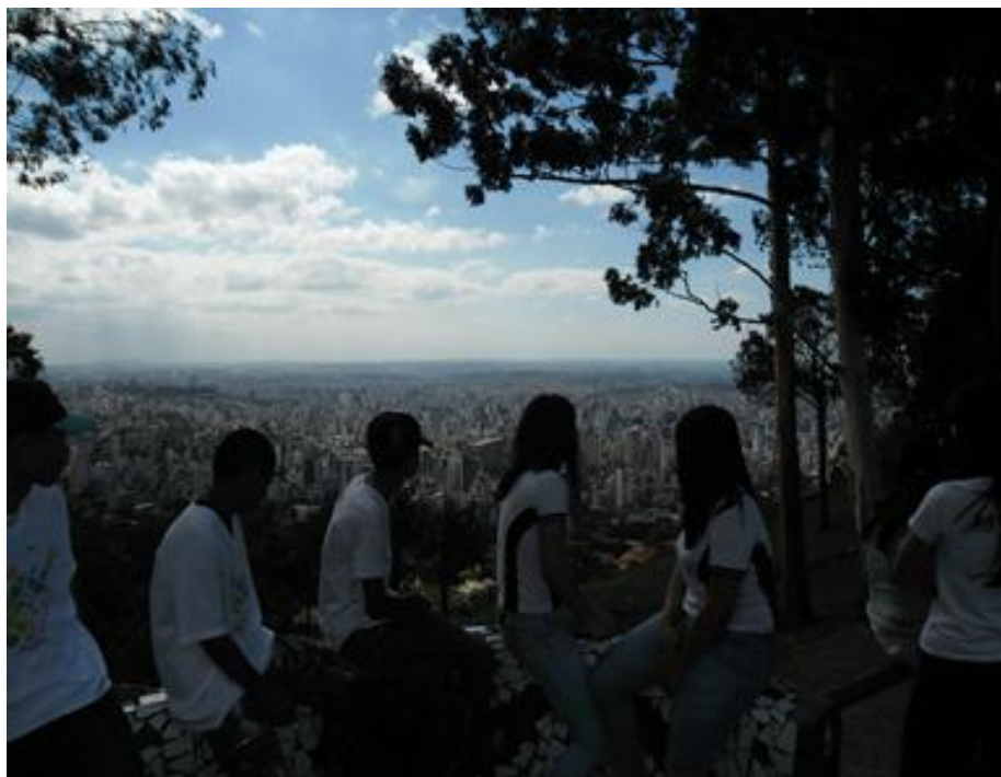
FIGURA 2: Trabalho de campo BH: É aqui que eu moro! Mirante das Mangabeiras

Ao transitarem pelas ruas do Mangabeiras, praça da liberdade e na orla da lagoa da Pampulha, os alunos passaram a ter um maior pertencimento em relação