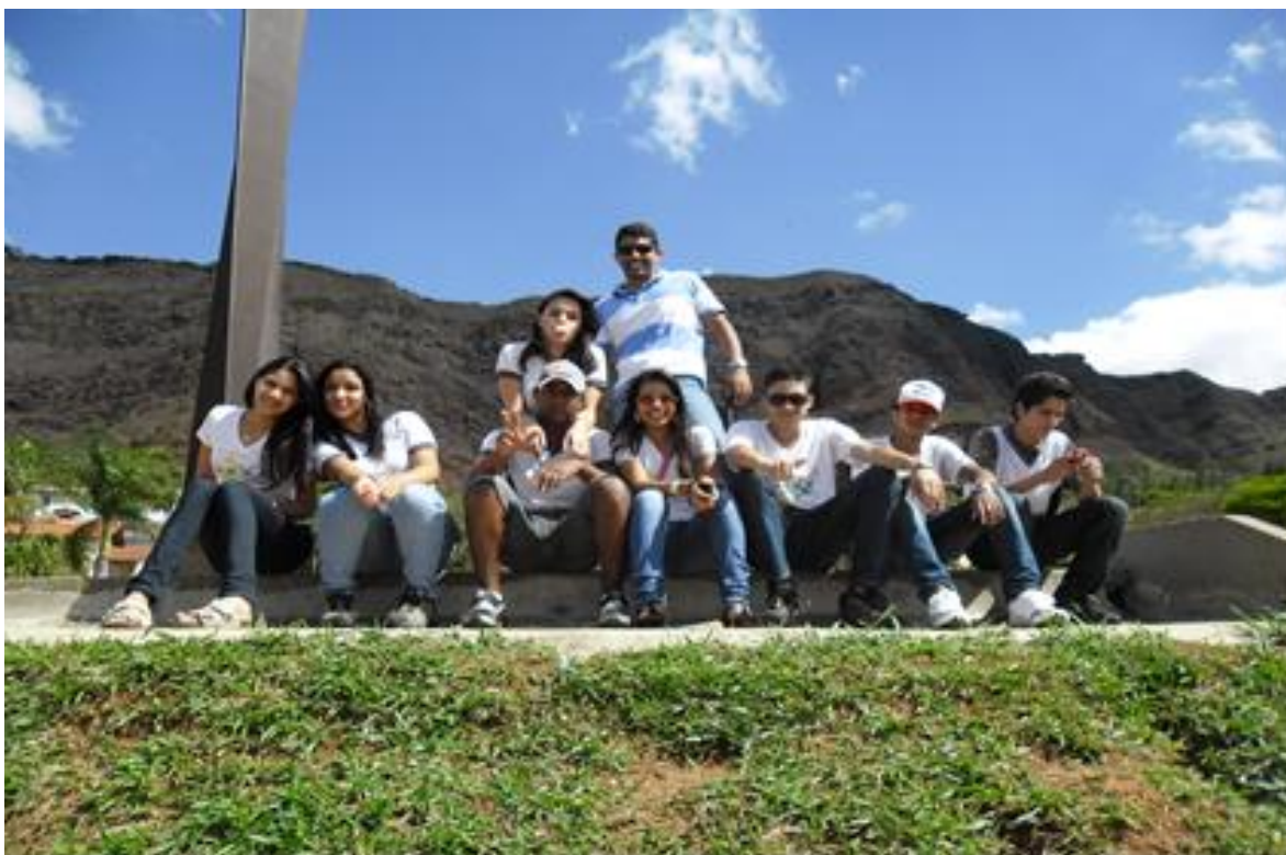
FIGURA 3: Trabalho de campo BH: É aqui que eu moro! Praça do Papa

ao espaço que habitam: Belo Horizonte. Muitos alunos não tinham consciência de que moravam em Belo Horizonte. “Nossa professor! A gente só via estes lugares na novela!”