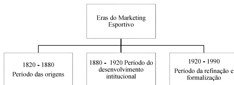
Figura 1. Eras do Marketing Esportivo

O aumento da importância do Brasil na indústria do esporte, principalmente por sediar dois dos principais eventos esportivos mundiais recentemente, a Copa do Mundo de Futebol (2014) e os Jogos Olímpicos (2016), pode ser um fator significativo para o crescimento de publicações na área do marketing esportivo. Moraes (2017) aponta que a produção acadêmica na área passou por um crescimento gradual a partir de 2005 com destaque para o período de 2013 a 2017. Porém, os estudos ainda são considerados recentes e em pequena quantidade, com foco no torcedor/consumidor e em patrocínios, havendo poucos trabalhos abordando a gestão de marketing nos clubes. A Figura 1 apresenta os principais momentos vivenciados pelo Marketing Esportivo.