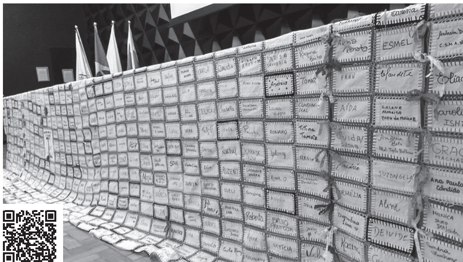
Figura 1.2. Colcha de Retalhos do Programa Para Elas – tecida por Elas e Por Eles.

Além dos projetos de pesquisa vinculados ao programa desde o seu início, um teve característica especial, que brotou das circunstâncias e se impôs por sua força, simplicidade e beleza – é o que versou sobre a colcha de retalhos e o efeito que produziu nas pessoas. Intencionalmente deixado para finalizar o capítulo, versa sobre um objeto que, como nenhum, poderia simbolizar tão bem a essência do programa: pessoas e partes de grande diversidade que, com seus saberes, competências, dificuldades, fragilidades e afetos, se unem, constituindo, de dentro de sua autonomia, um conjunto duradouro, capaz de insistir, durar e transformar o mundo (Figura 1.2).