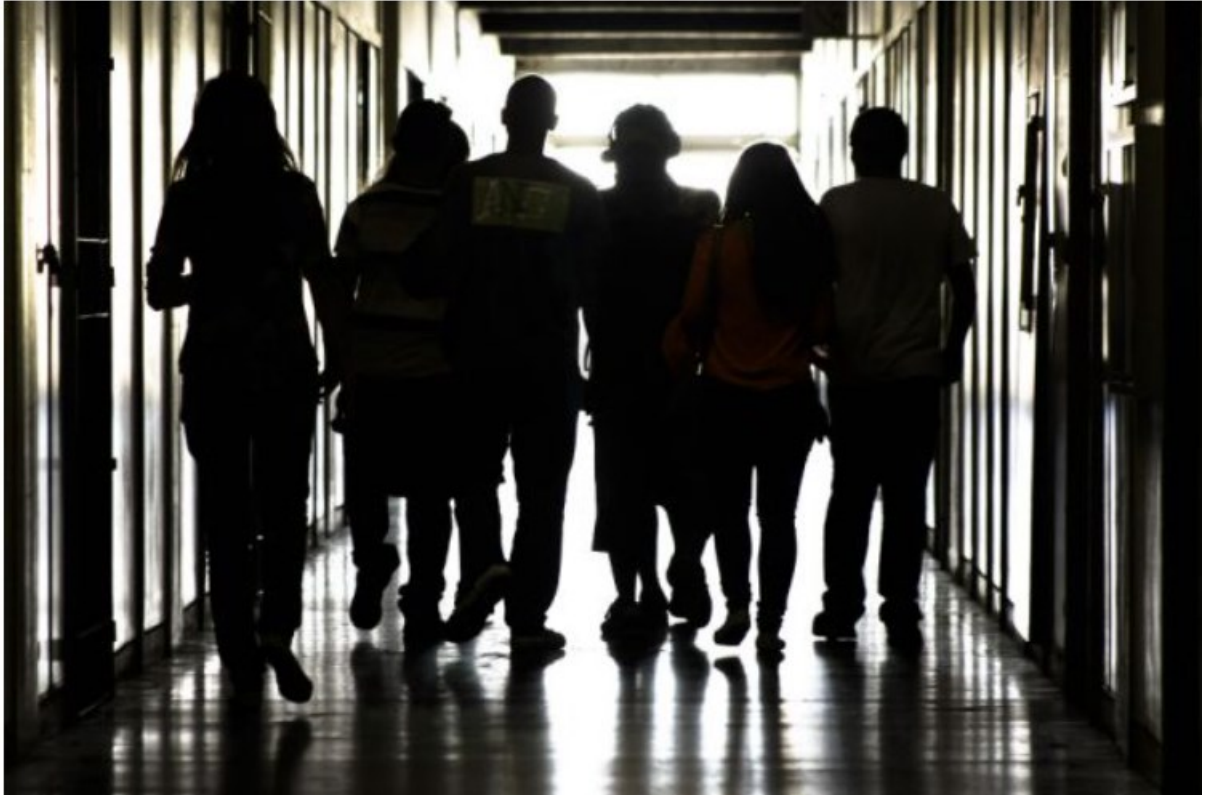
Figura 5 – Documentário “Fora de Série”