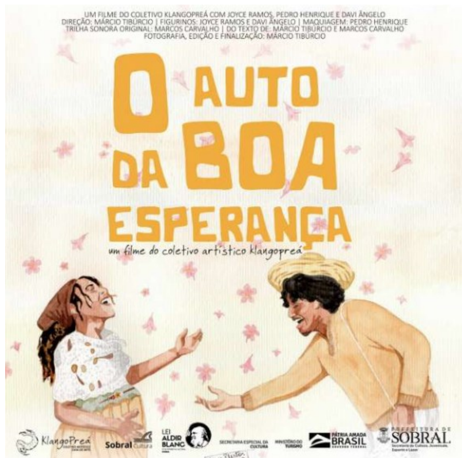
Figura 4 – Curta Metragem O Auto da Boa Esperança