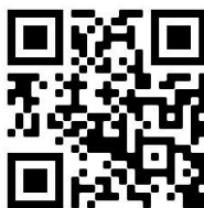
Figura 1 - Vídeo: Apresentação do livro “O bicho folharal” pela professora Cintia Paula dos Santos