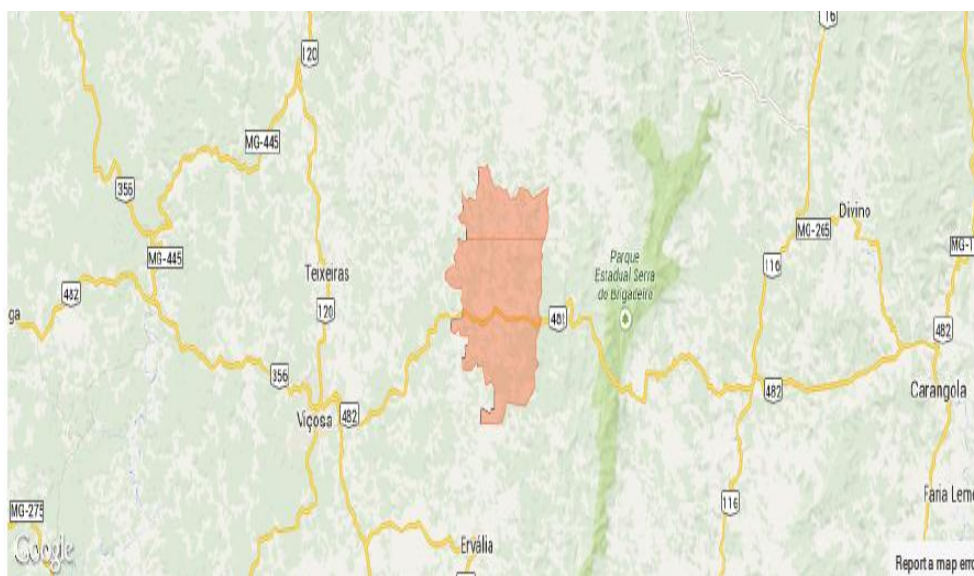
Figura 3: Localização geográfica de Canaã