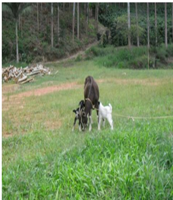
Figura 2-Criação de cabritos

se a transformar pensamentos e conhecimentos: “No início foi difícil a forma de cuidar dos cabritos, pelo fato de ficar 15 dias na EFA estudando e a família já tinha muitas outras atividades pra fazer na propriedade”. (J.L.de Barros 20 anos)